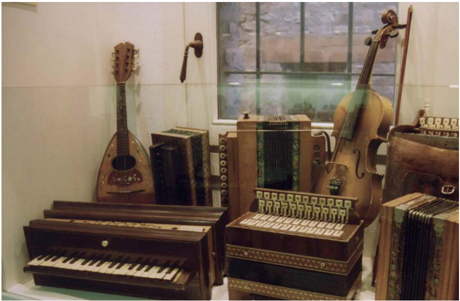
Museu de l'Acordió. Arsèguel