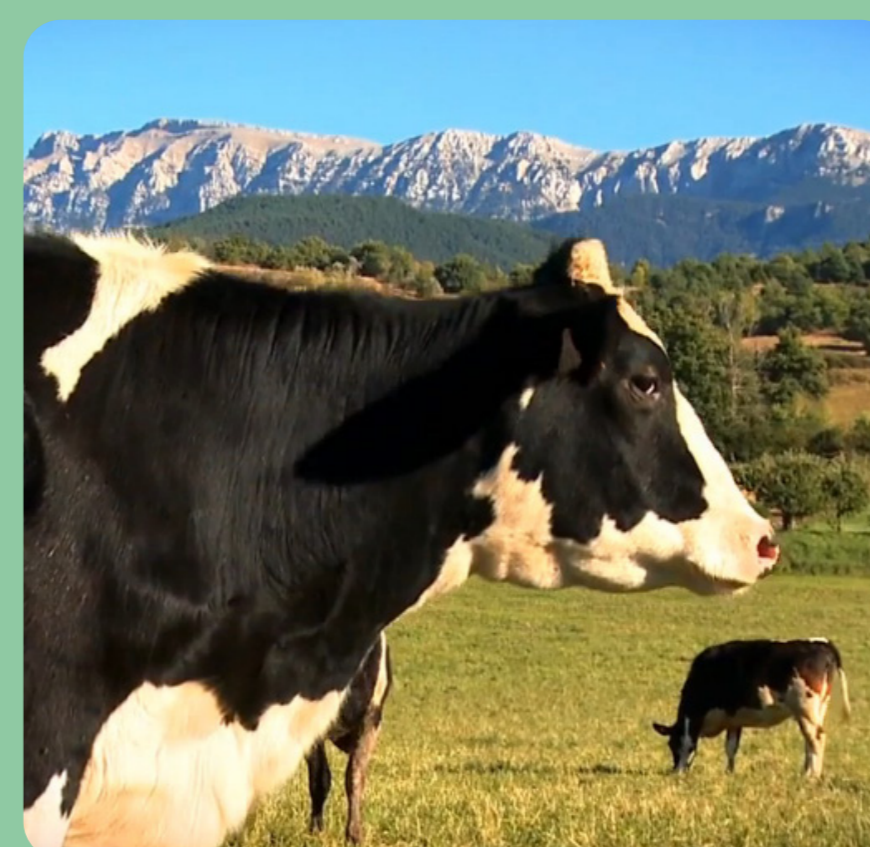
Vaques frisonnes a la plana de l'Urgellet

une activité d'élevage de brebis et de chèvres venaient les compléter. On s'approvisionnait aussi beaucoup dans les forêts pour faire du bois et du charbon, entre autres. L'aspect du paysage était très différent : des couleurs terreuses et une masse forestière très faible. Le paysage actuel est né des profondes transformations économiques engendrées au début du xxe siècle avec l'introduction des vaches à lait et la transformation des anciens champs de culture en prairies de fauche suite aux propositions lancées par Josep Zulueta, le fondateur de la Coopérative Cadí et instigateur de la modernisation économique du territoire.