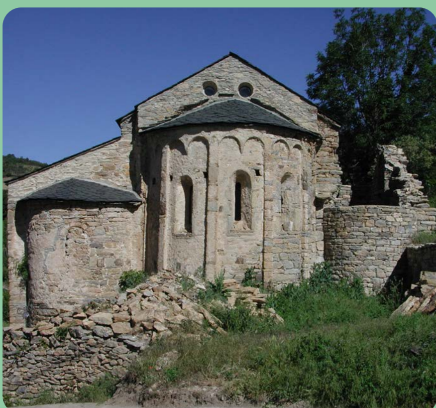
Capçalera de l'església vella de Sant Vicenç d'Estamariu

A los pies de Estamariu, río Segre abajo, se abre la llanura del Urgellet. A lo largo de 20 kilómetros, desde la salida del Baridà por el estrecho de las Cabanotes hasta el desfiladero de Trespunts, el Urgellet se configura como una extensa llanura fértil y bien irrigada encabezada por la Seu d'Urgell, su núcleo principal. Hasta finales del siglo XIX los cultivos eran de cereales, legumbres y viña, con un complemento ganadero a base de ovejas y cabras y un aprovechamiento intensivo del bosque para obtener lenya y carbón, entre otros usos. El aspecto del paisaje resultaba muy diferente entonces, con colores terrosos y escasa masa forestal. El paisaje actual es fruto de las profundas transformaciones económicas que sufrió desde principios del siglo XX, con la introducción de las vacas lecheras y la transformación de los antiguos campos de cultivo en prados de pastos a raíz de las propuestas impulsadas por Josep Zulueta, fundador de la Cooperativa Cadí e impulsor de la modernización económica del territorio.