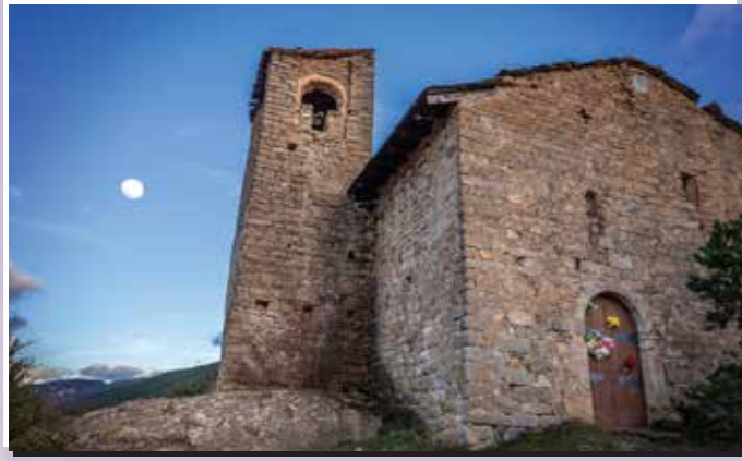
2 Ermita de la Mare de Déu de les Peces