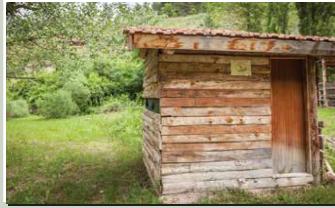
4 Parc temàtic els Moixons