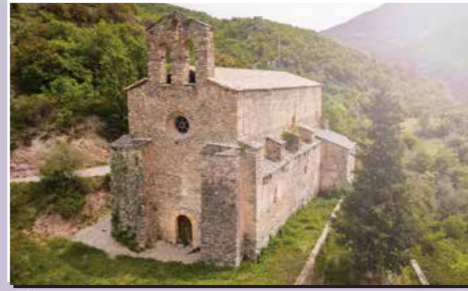
1 Sant Martí de Tost