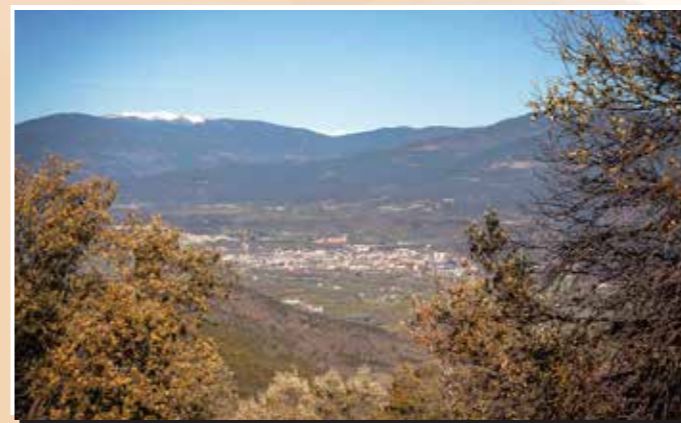
2 Mirador d'Artedó