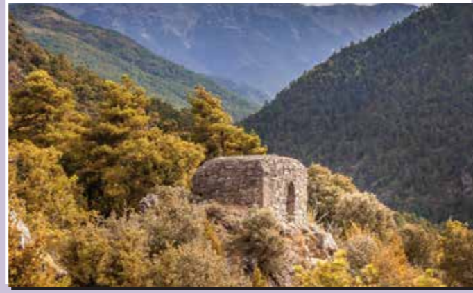
3 Búnquers del bosc de Rossa