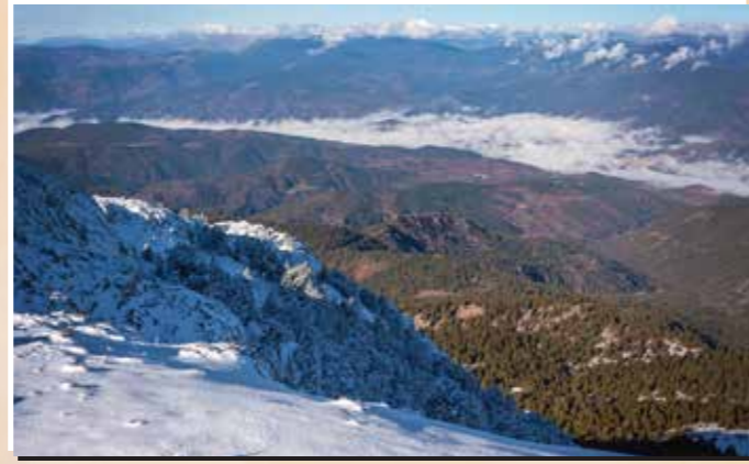
10 Mirador de la Torreta de Cadí