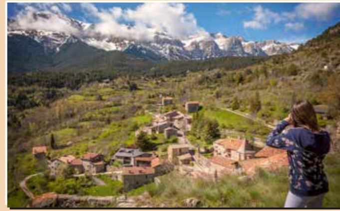
8 Mirador del Querforadat