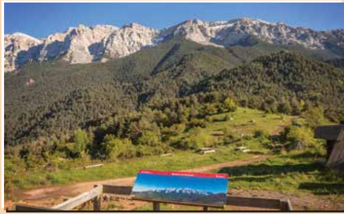
6 Mirador de Boscall