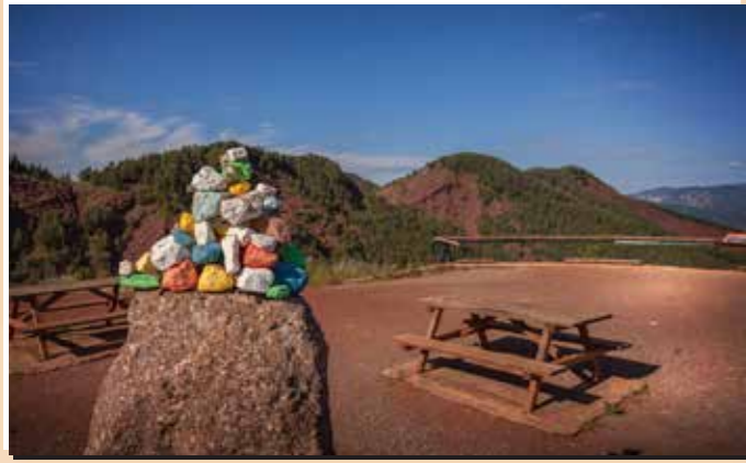
9 Mirador de la Trava