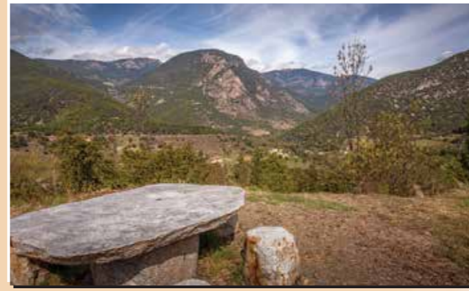
5 Mirador d'Arsèguel