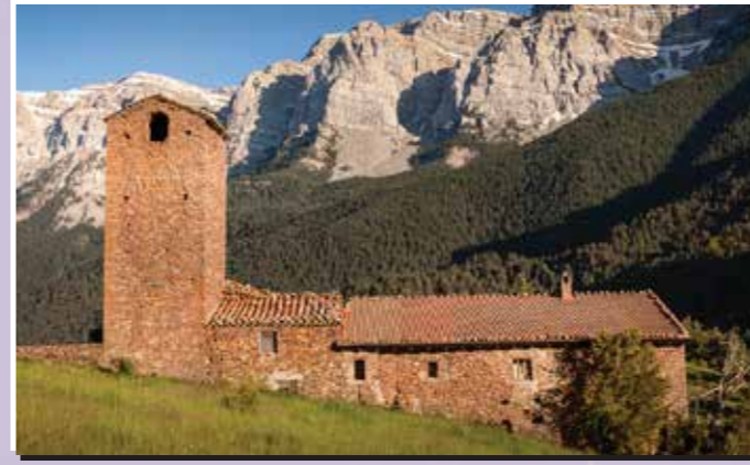
4 Santuari de Boscall