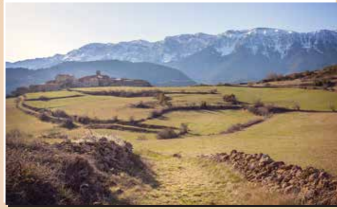
4 Mirador de Vilanova de Banat