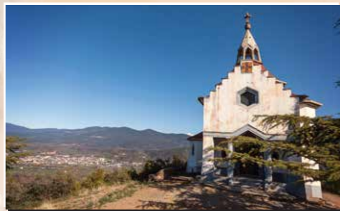
1 Mirador de Sant Antoni