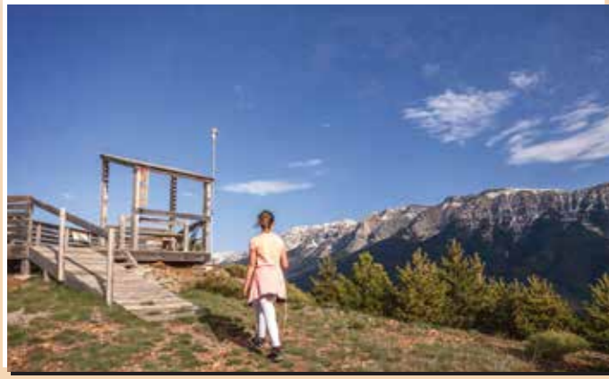
3 Mirador del turó Galliner