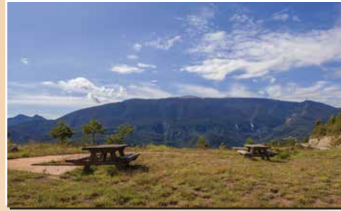
11 Mirador de coll de Bancs