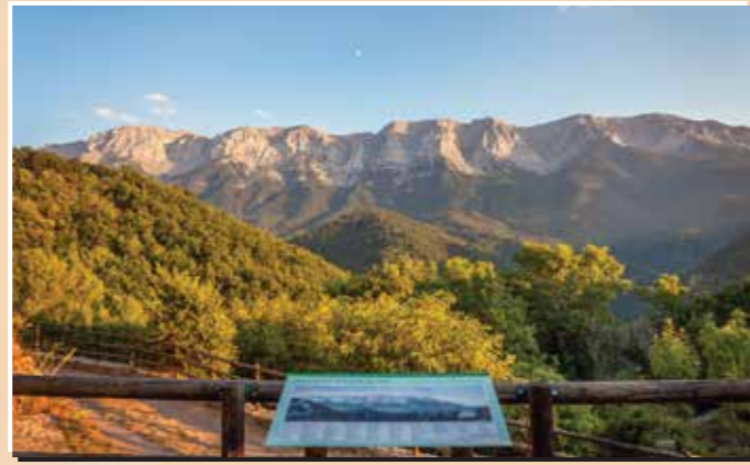
7 Mirador de Cava