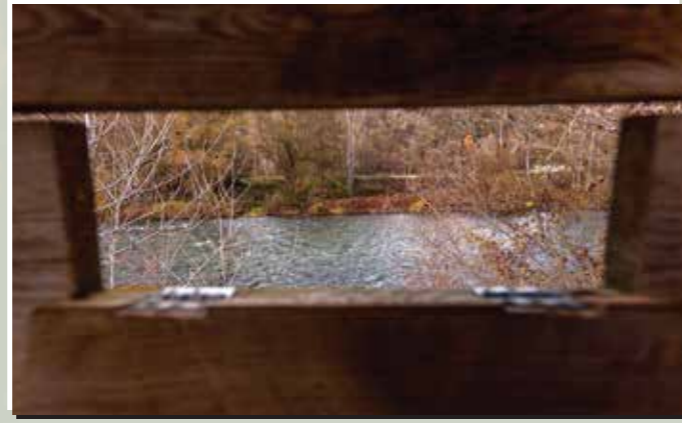
1 Aguaites d'Arfa