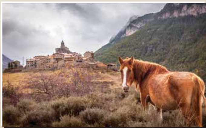
4 Josa de Cadí