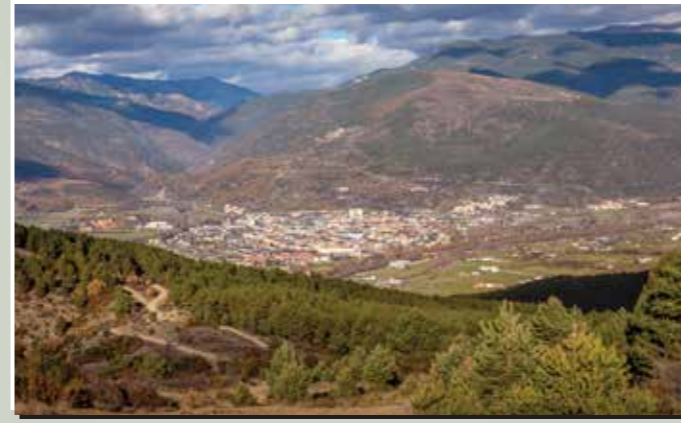
2 Serra de Nabiners