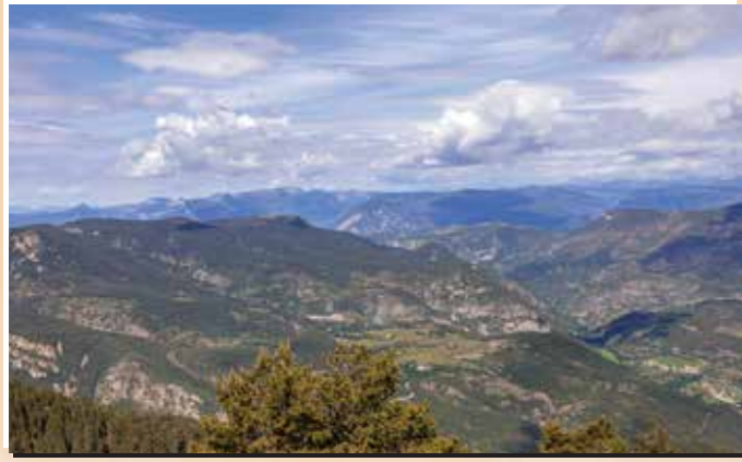
12 Mirador de l'Arp