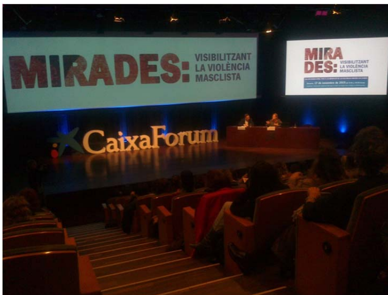
Jornada a Barcelona amb els SIE