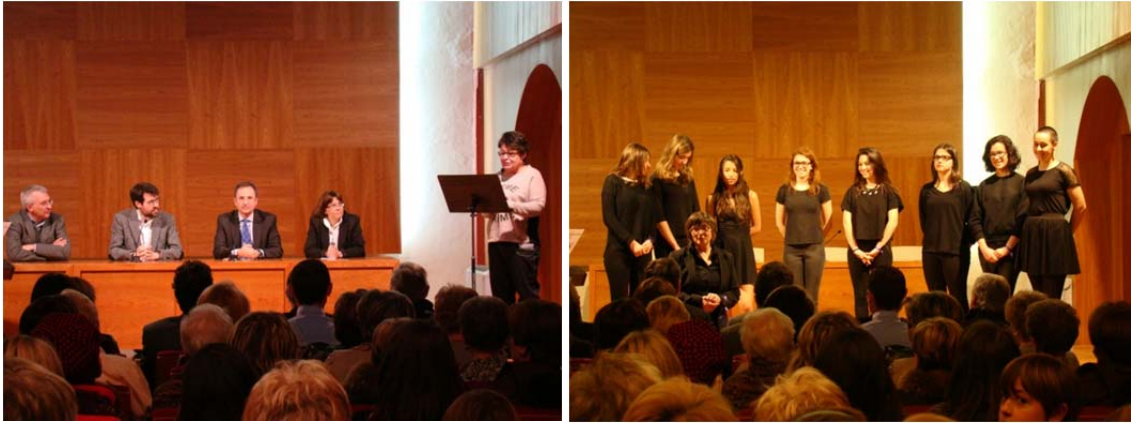
8 de març, Dia Internacional de les Dones. Acte institucional de la Vegueria de l'Alt Pirineu i Aran