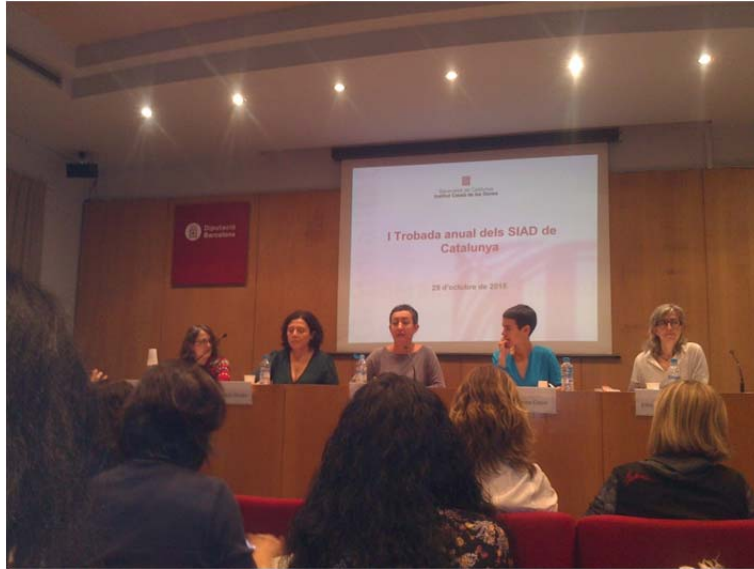
I Trobada anual dels SIAD de Catalunya