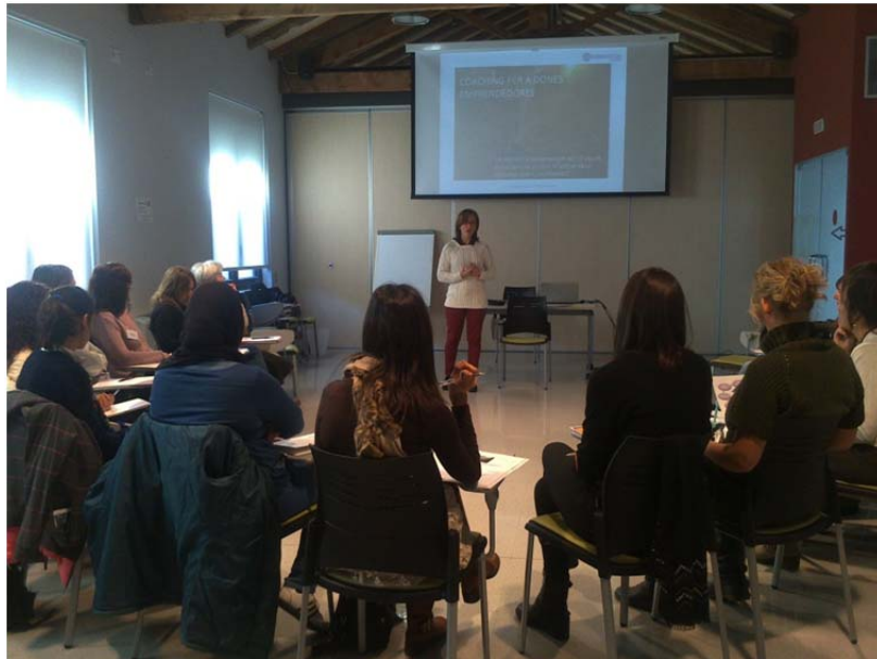
Projecte dona i lideratge de coaching per a emprenedores