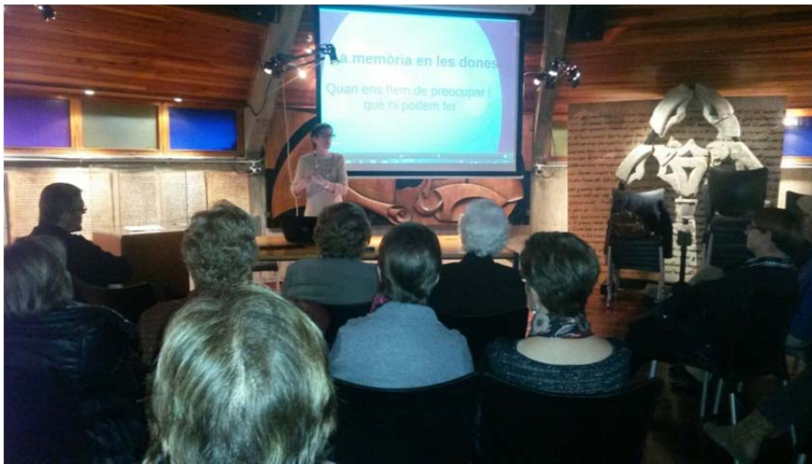
Cicle Benestar i qualitat de vida per a la dona. Sessió a Organyà