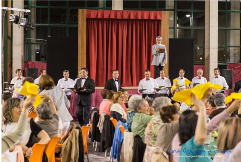
Sopar de les dones “fet pels homes” a Oliana