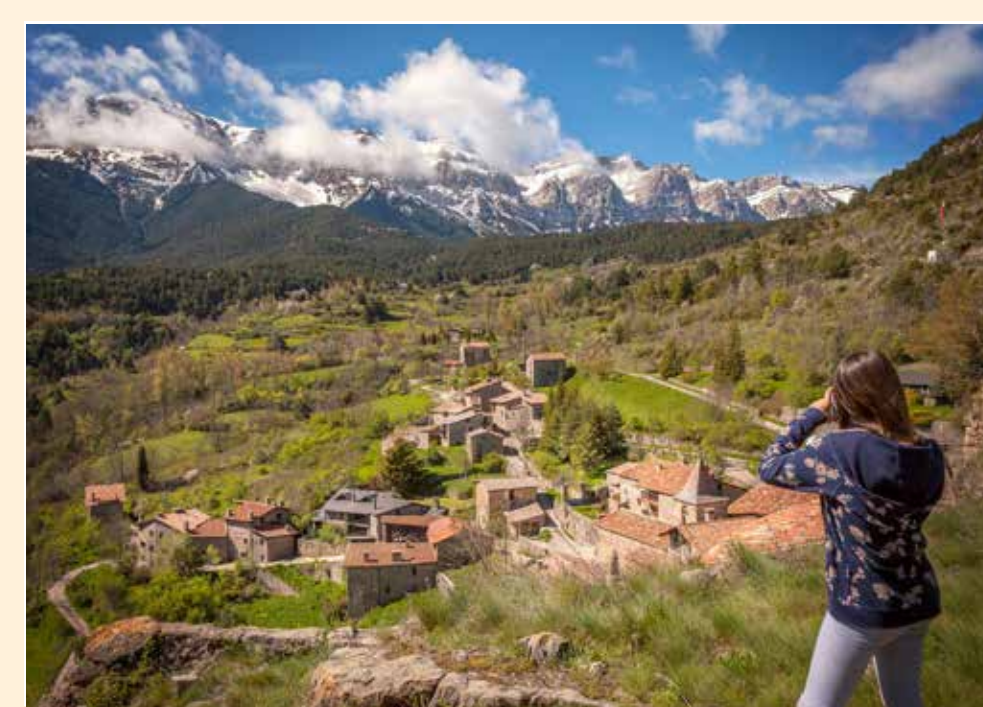
3 Mirador del Querforadat Mirador / Lookout / Point de vue