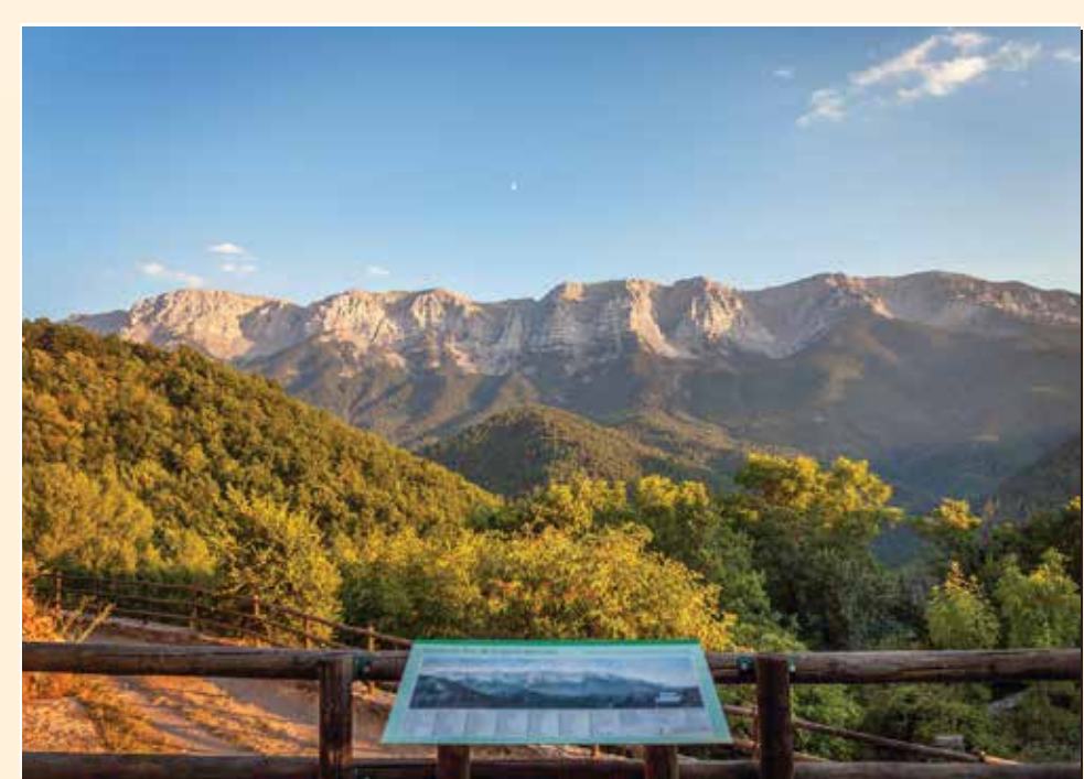
2 Mirador de Cava Mirador / Lookout / Point de vue