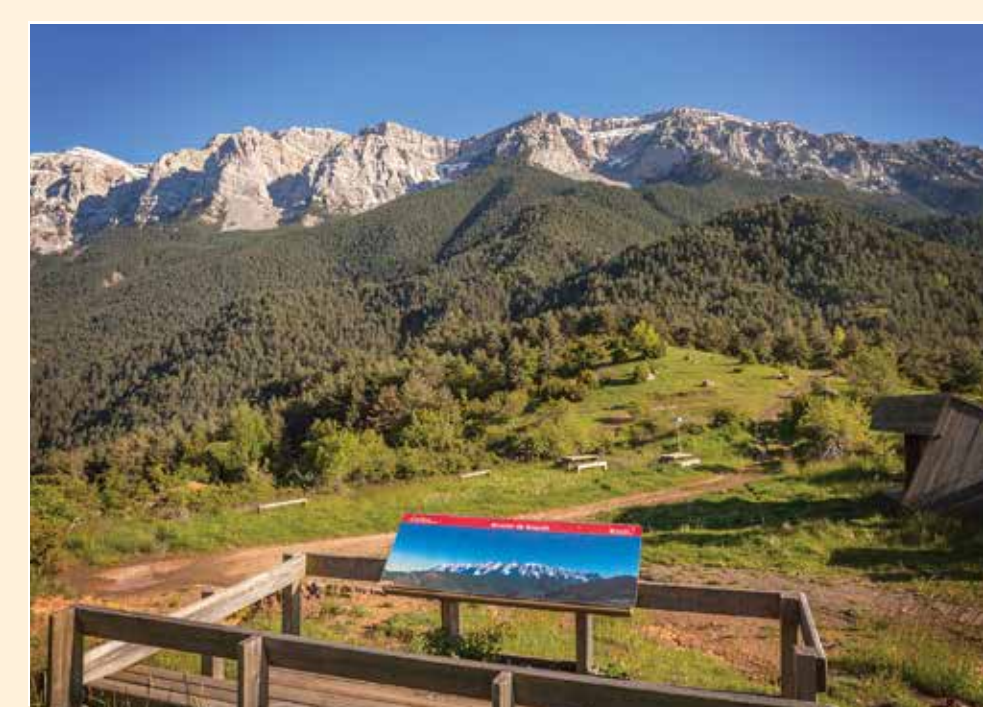
1 Mirador de Boscall Mirador / Lookout / Point de vue