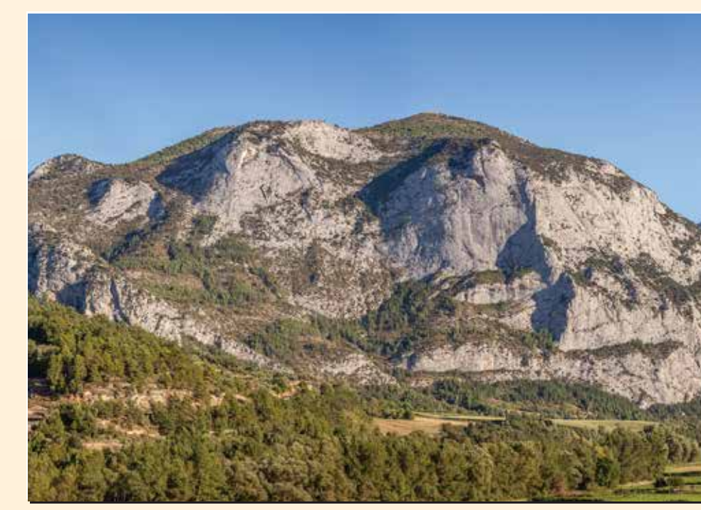
1 Figols (Roca Narieda) Mirador / Lookout / Point de vue