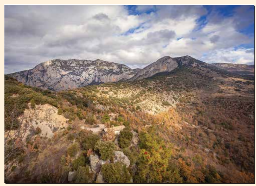
3 Mirador dels Voltors - Sant Ponç Mirador / Lookout / Point de vue