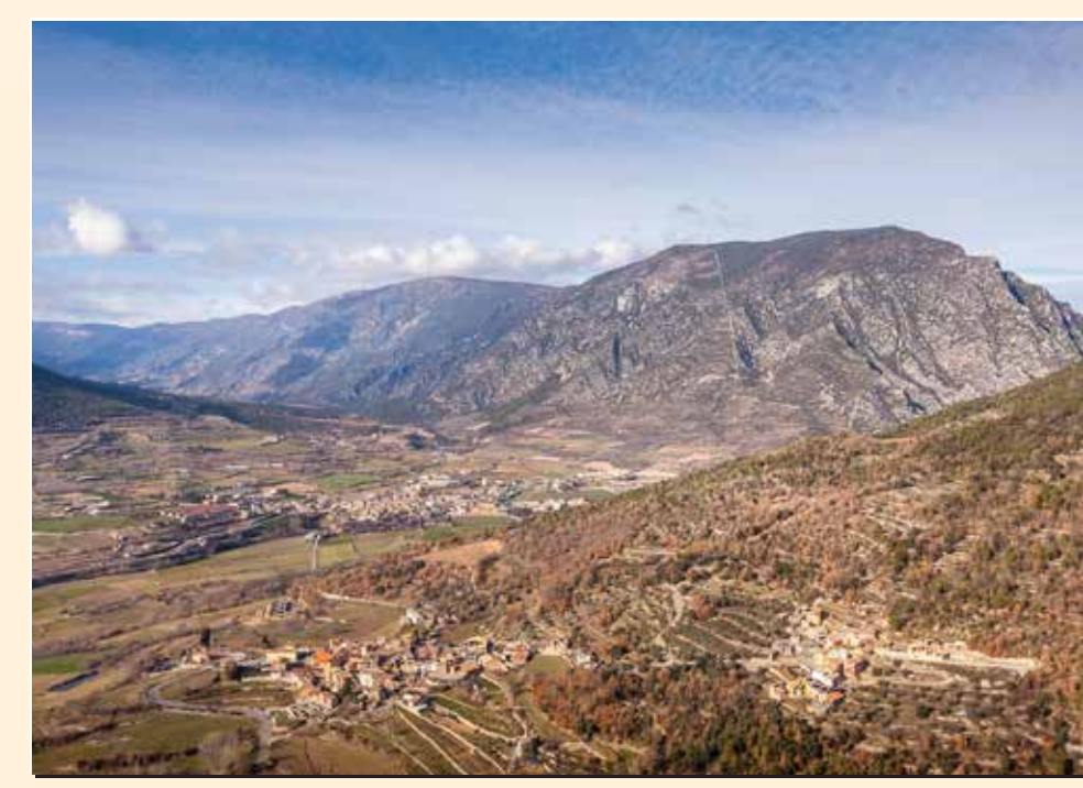
2 Mirador de Narieda Mirador / Lookout / Point de vue