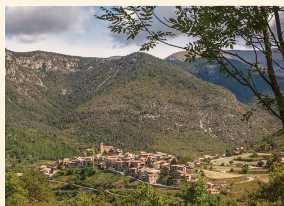
1 Tuixent Pueblo / Village / Village