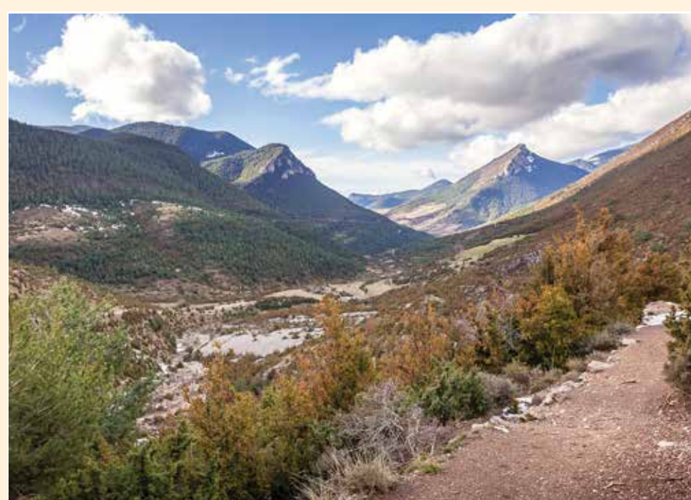
3 Cerneres Mirador / Lookout / Point de vue