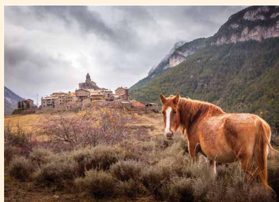
2 Josa de Cadí Pueblo / Village / Village