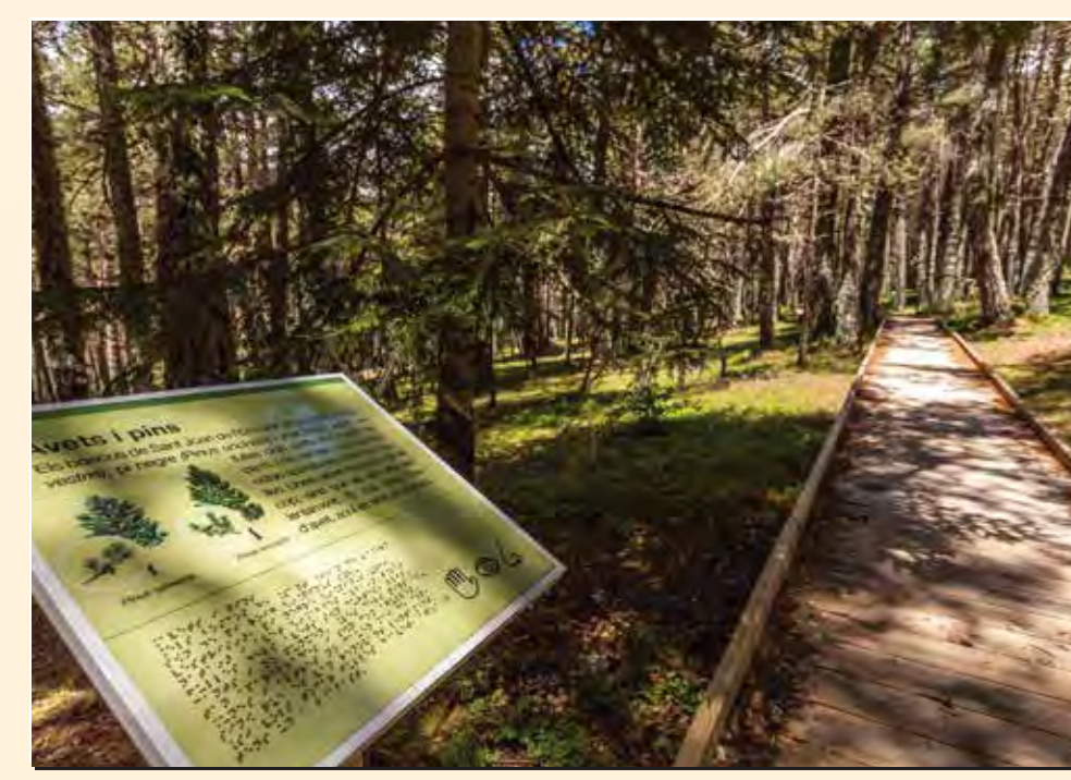
2 Itinerari adaptat de Sant Joan de l'Erm Itinerario adaptado / Adapted itinerary / Sentier adapté