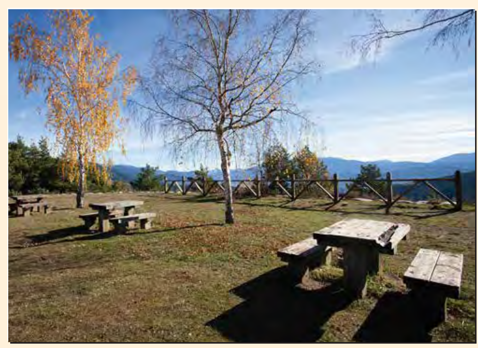
3 Mirador de la collada del Pubill Mirador / Lookout / Point de vue