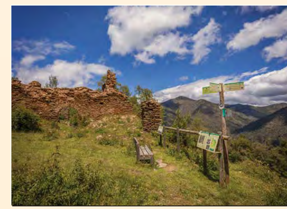
1 Mirador de Sant Joan de l'Erm vell Mirador / Lookout / Point de vue