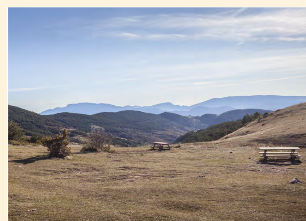
2 Mirador del port del Cantó Mirador / Lookout / Point de vue