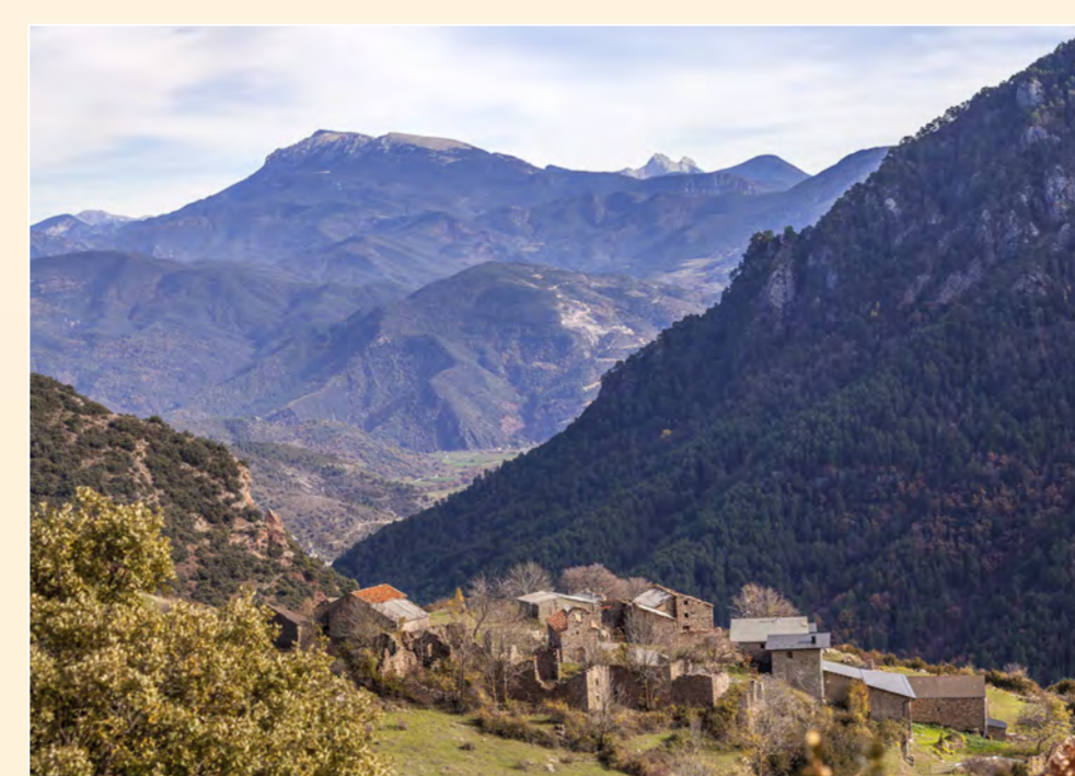
3 Trejuvell Pueblo / Village / Village