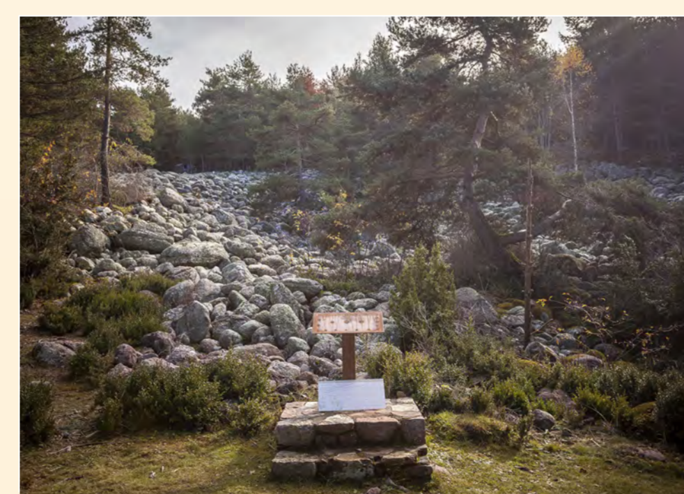
4 Tarters dels Minairons Paraje singular / Singular place / Lieu singulier