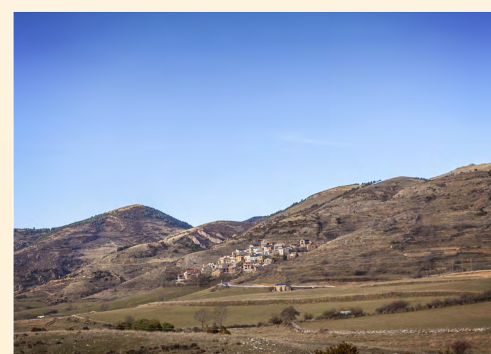
1 Taús Pueblo / Village / Village