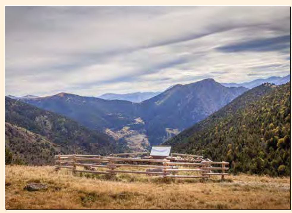
3 Mirador de la collada de Conflent Mirador / Lookout / Point de vue