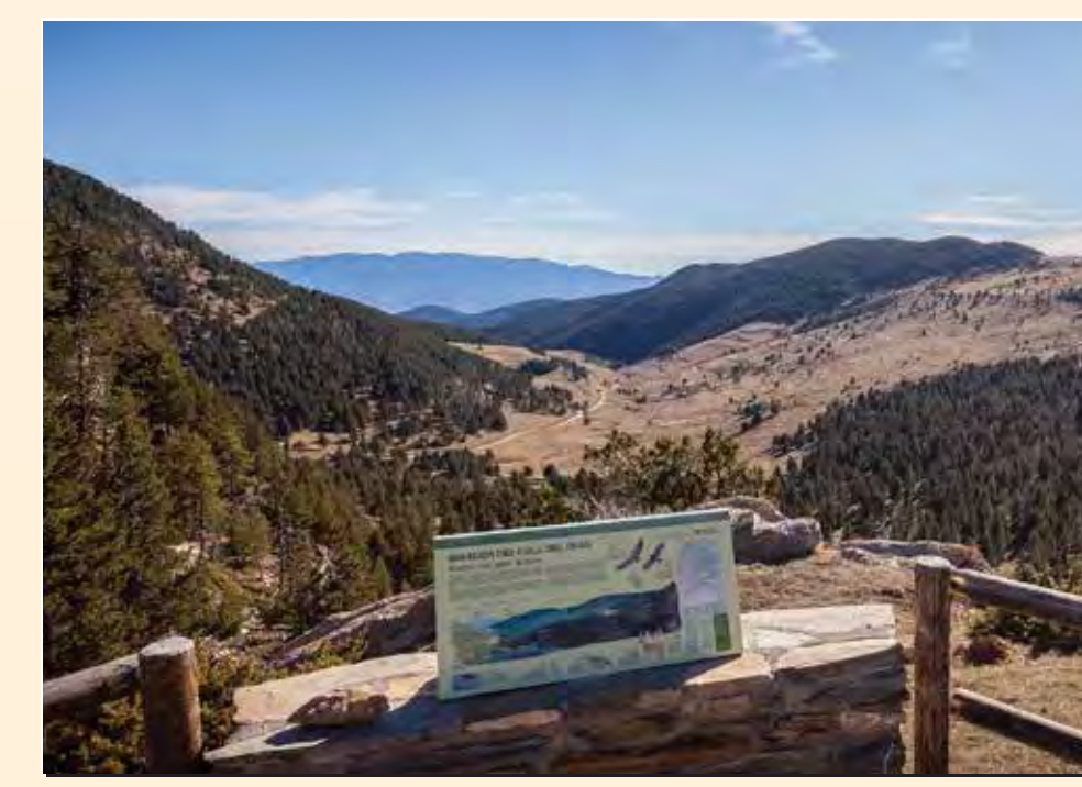
1 Mirador del coll del Grau Mirador / Lookout / Point de vue