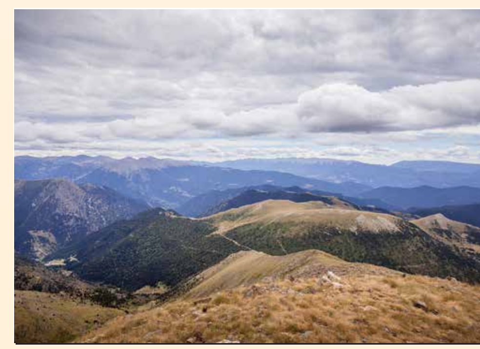
2 Mirador del cim de Saloria Mirador / Lookout / Point de vue