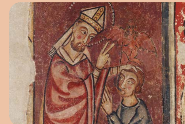
Bisbe Ermengol d'Urgell. Detall d'un fresc del segle XIII del Museu Diocesà d'Urgell Obispo Ermengol de Urgell. Detalle de un fresco del siglo XIII del Museo Diocesano de Urgell Bishop Ermengol of Urgell. Detail from a 13th century fresco in the Diocesan Museum of Urgell Évêque Ermengol d'Urgell. Détail d'une fresque datant du XIIIe siècle au Musée Diocésain d'Urgell