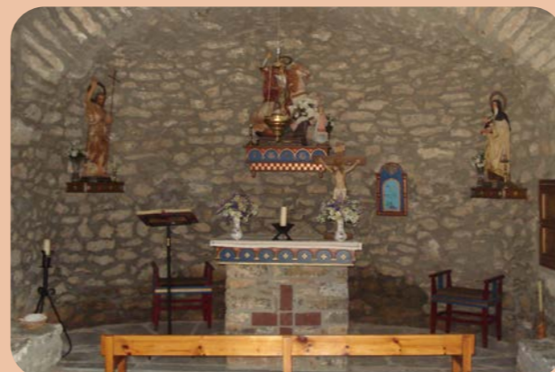
Altar major de la capella de la Mare de Déu del Roser de Toloriu Altar mayor de la capilla de la Virgen del Roser de Toloriu High altar at the church of Mare de Déu del Roser in Toloriu Maitre-autel de la chapelle de la Mare de Déu del Roser de Toloriu

Les gorges d'El Baridà sont étroitement liées à la mémoire de l'évêque Ermengol, l'un des prélats les plus célèbres de la région d'Urgell qui trouva la mort au Pont de Bar en 1035. Ermengol d'Urgell s'est fait remarquer pour avoir entamé la promotion et la construction de grandes infrastructures routières, notamment des ponts et des chemins, qui avaient pour objectif de favoriser la croissance économique de la Seu d'Urgell. En 1035, pendant l'inspection du chantier d'un pont en cours de construction au-dessus du Sègre, à l'endroit qui sera connu sous le nom de Pont de Bar, il est mort en chutant d'un échafaudage. Quelques années plus tard, il a été élevé aux honneurs des autels puis vénéré en Saint Patron de la Seu d'Urgell. Au fil des siècles, le pont construit au Pont de Bar a subi des effondrements successifs causés par des averses torrentielles. Les plus récentes, en 1982, ont emporté une bonne partie du bourg de la commune, qui s'est reconstruit un kilomètre et demi en aval.