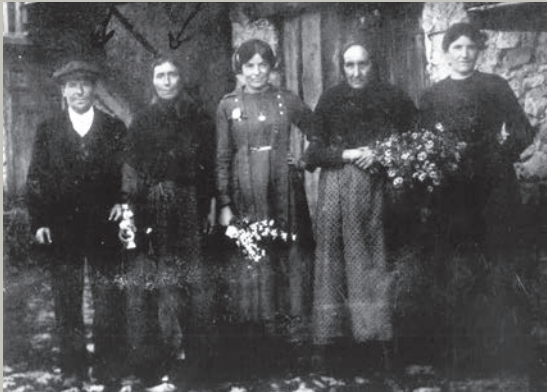
Trementinaires de Tuixent. C. 1920