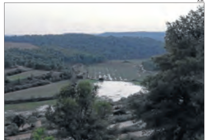
L'extensió inundada supera les 300 hectàrees.