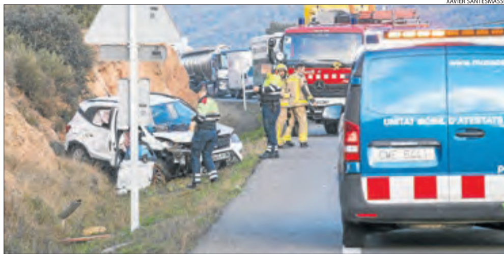
Accident d'ahir a la C-14, amb una persona morta i quatre de ferides.

Tràgica ratxa || Aquest any no hi havia hagut víctimes mortals en vies de Ponent i en dos dies ja són quatre