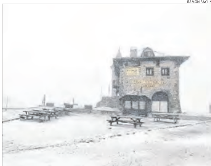
La nevada al port de la Bonaigua.