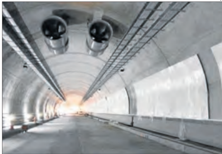
L'estat dels treballs a l'interior del túnel d'aquesta setmana.

Aquesta inversió, de 35,4 milions, és actualment la més important en les infraestructures viàries a Lleida. La conselleria va explicar que han acabat d'eixamplar el tram de la C-14 que passa de set a 10