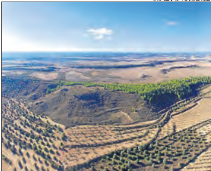
Vista dels paisatges que recorre la ruta de Puigverd de Lleida.