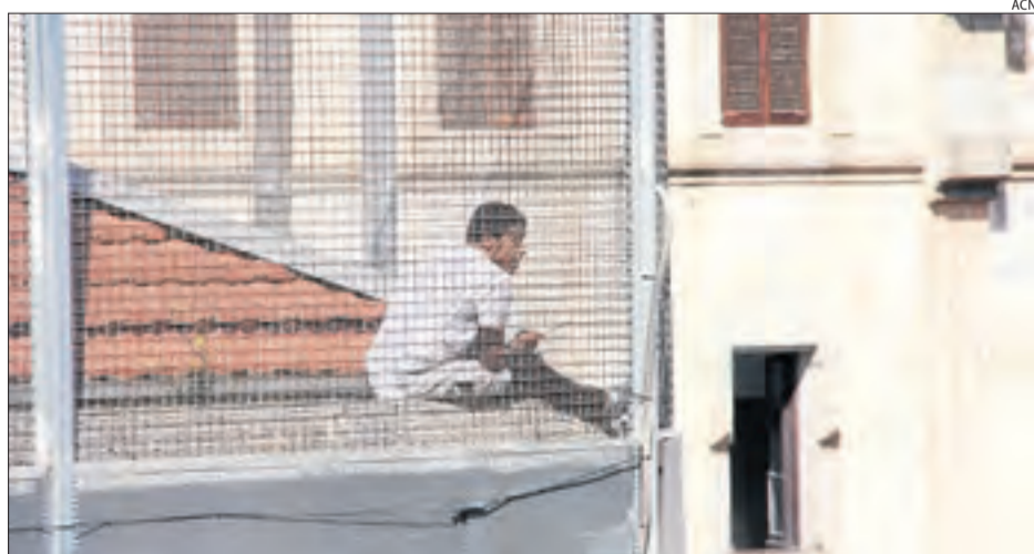
El jove, de 21 anys, ahir a la teulada de la presó Model de Barcelona.