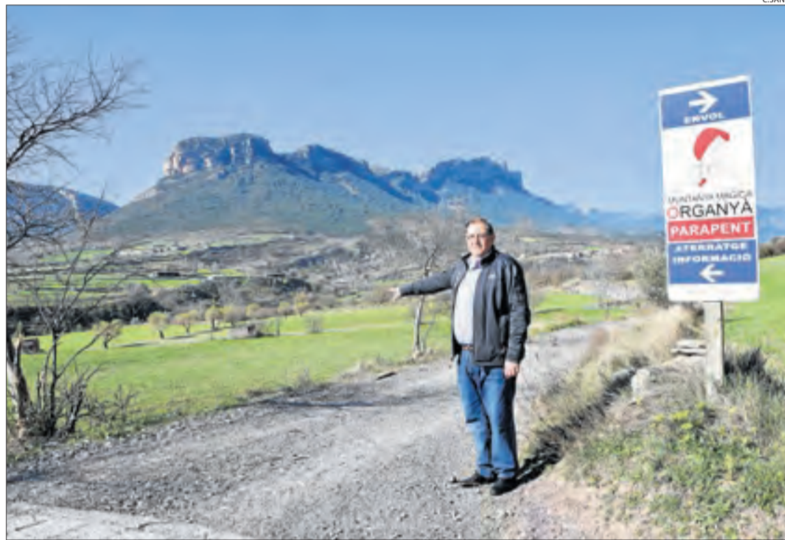
L'alcalde d'Organyà a la zona d'aterratge de parapent.

El consistori i els propietaris van presentar al·legacions al procés d'expropiació dels terrenys al·legant que "la ubicació