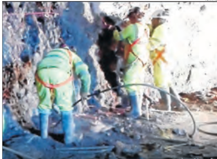
Imatges dels operaris treballant a l'interior de la galeria del túnel de Tres Ponts, a la C-14.