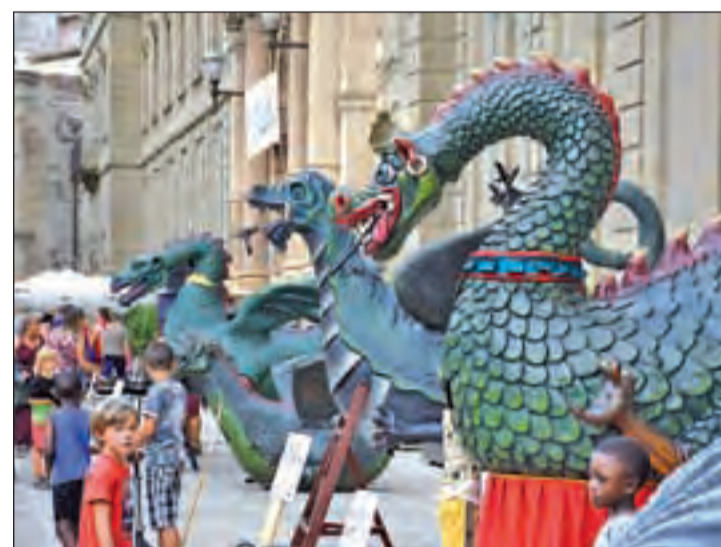
La Plaça de la Universitat de Cervera se llenó de 'besties'