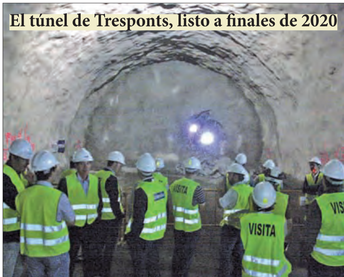
Los dos frentes de excavación de la galería en la C-14 se encontraron ayer | PÁG. 11