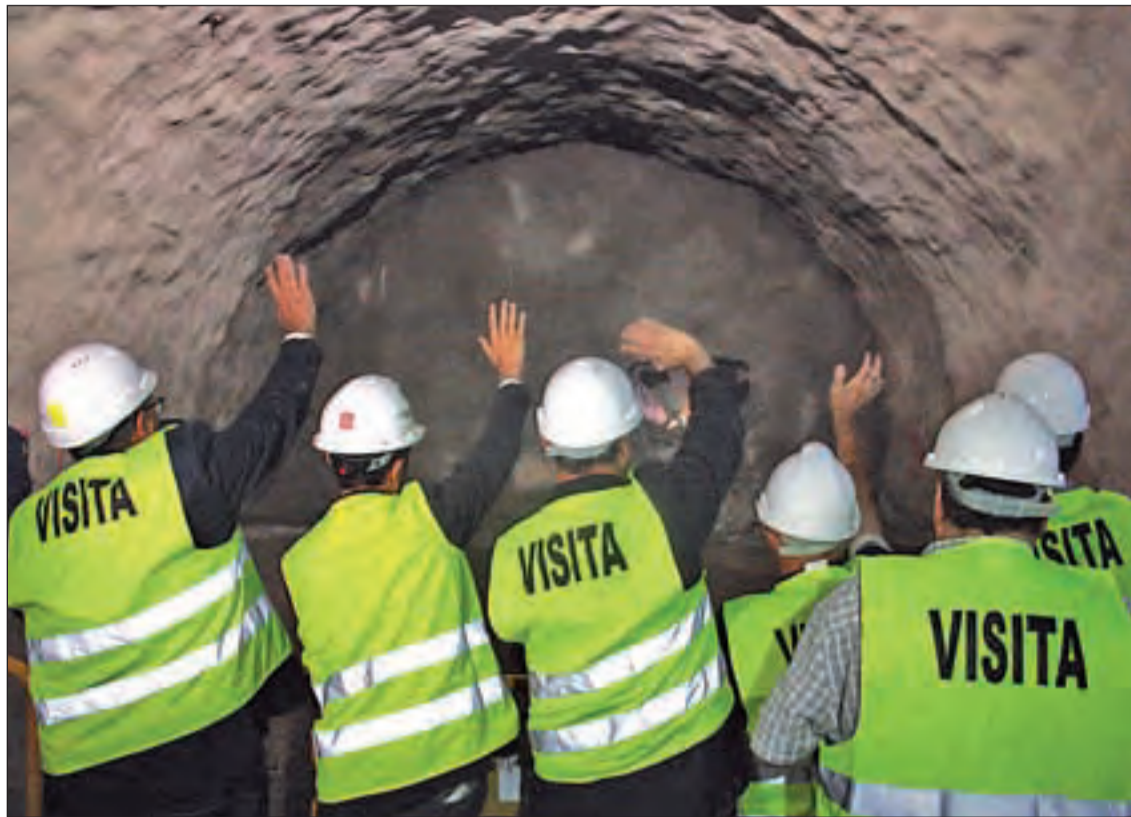
El conseller Calvet assistí a l'acte simbòlic de la calada