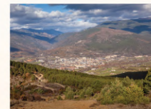
2 Serra de Nabiners Paratge singular / Singular place / Lieu singulier