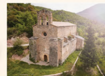
3 Sant Martí de Tost Iglesia / Church / Eglise