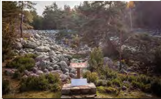
1 Tarters dels Minairons