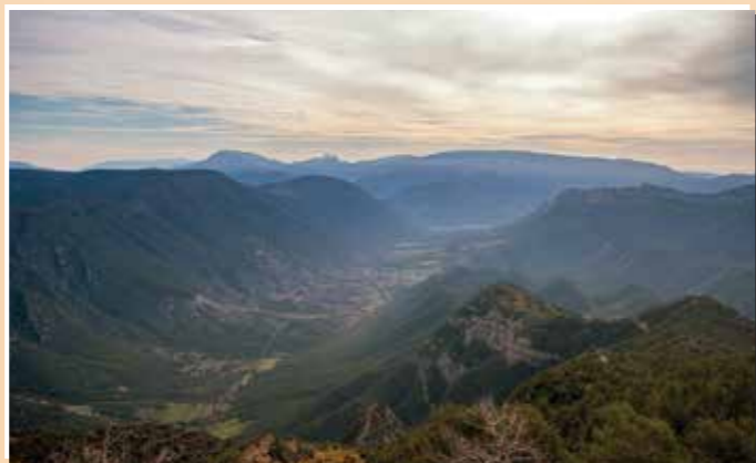
2 Mirador de la vall de Cabó