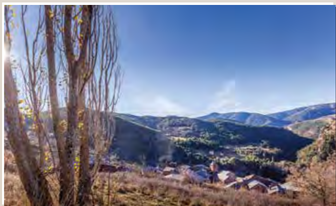
2 Guils del Cantó