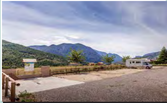
1 Àrea d'autocaravanes d'Organyà