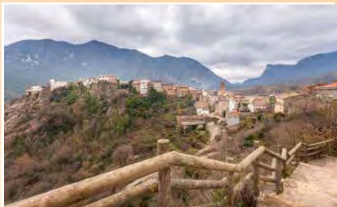
4 Mirador de Coll de Nargó