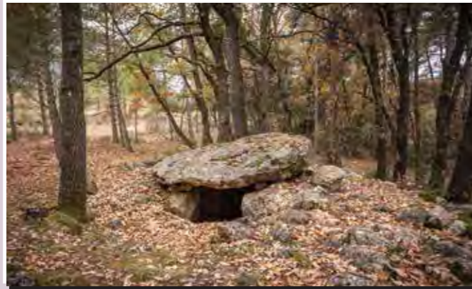
2 Dolmen de Colomera