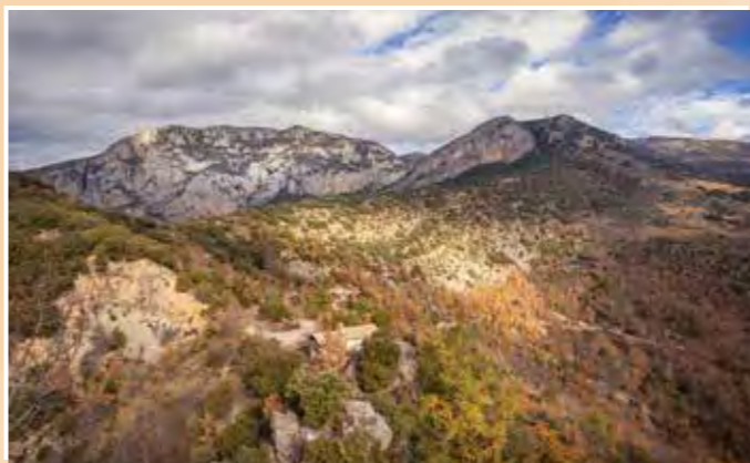
6 Mirador dels Voltors