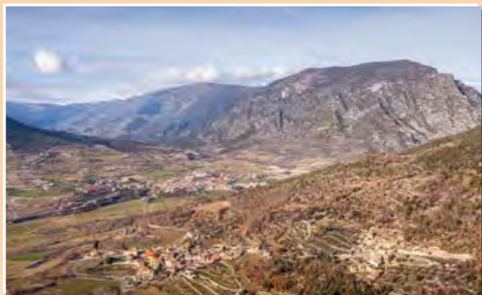
5 Mirador de Narieda