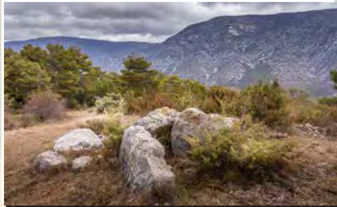
4 Vall de Cabó