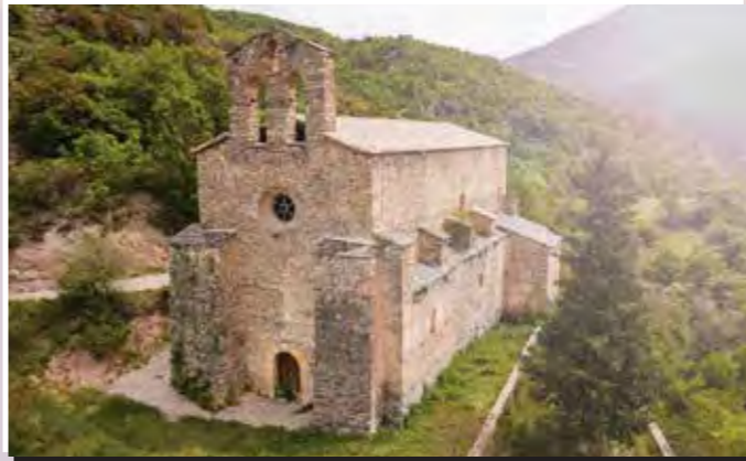
3 Sant Martí de Tost