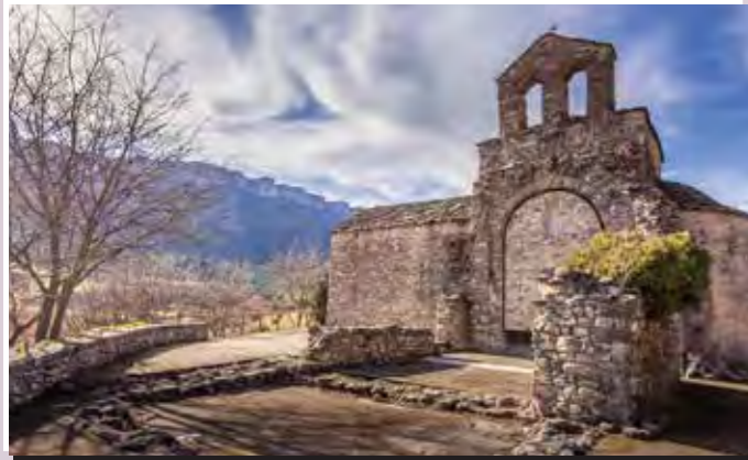
1 Sant Serni de Cabó