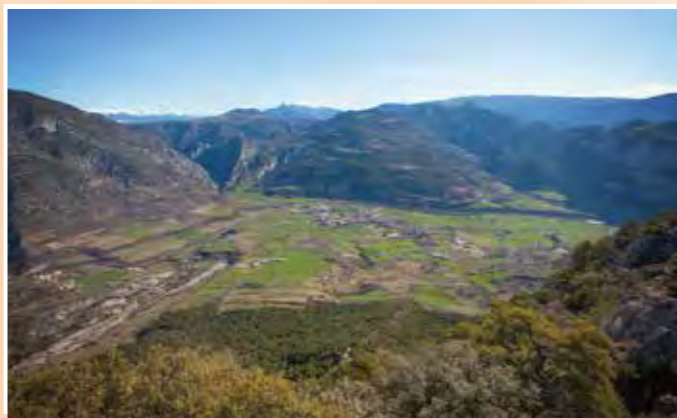
3 Mirador de Santa Fe