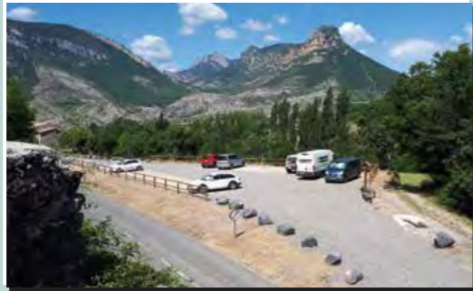
2 Aparcament de caravanes de Figols