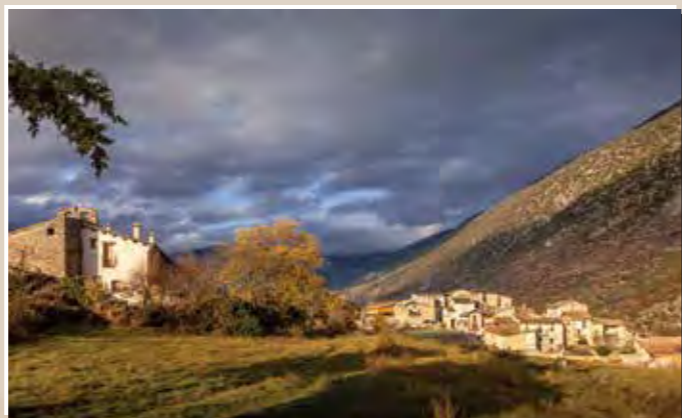
5 El Vilar de Cabó