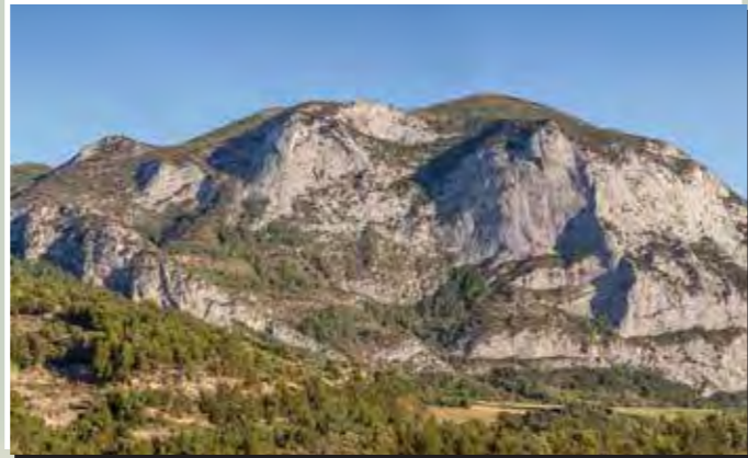
5 Roca de Narieda