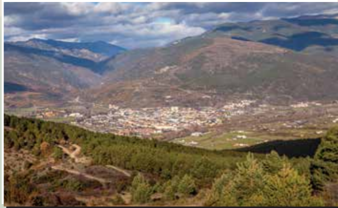
3 Serra de Nabiners