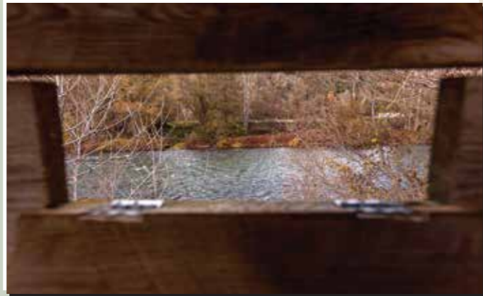
2 Aguait d'Arfa