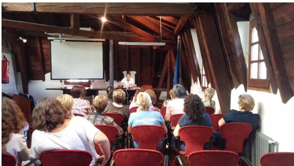
Presentació de l'estudi d'entitats de dones i informació sobre la reforma horària