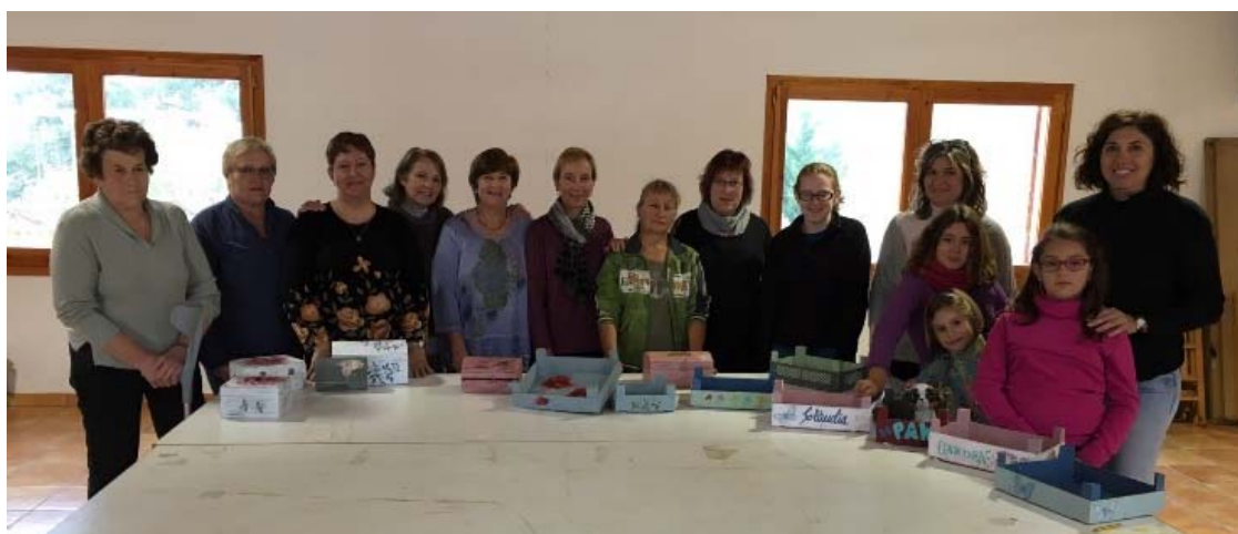
Pintura de caixes de fusta amb tècnica Chalk Paint a Bassella