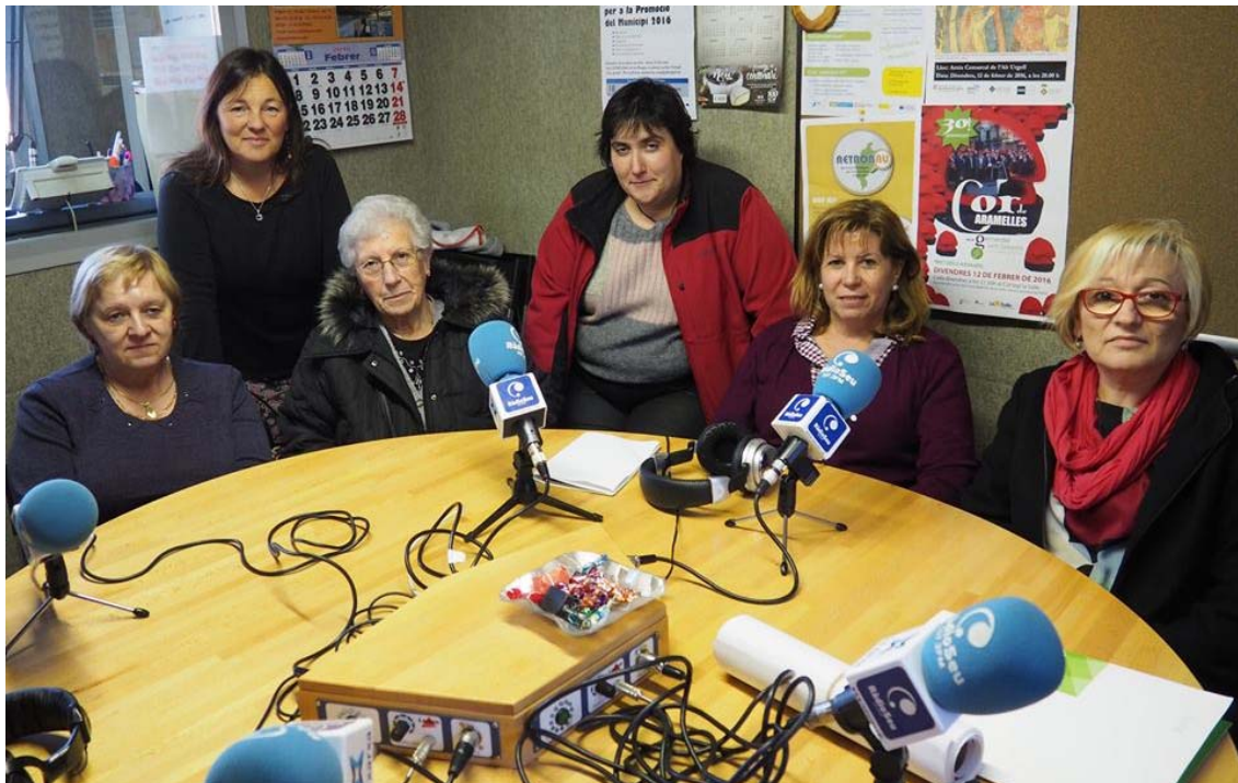
8 de març, Dia Internacional de les Dones. Difusió a Ràdio Seu