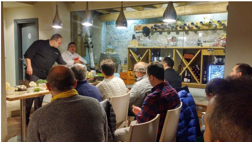
Taller de cuina per a homes