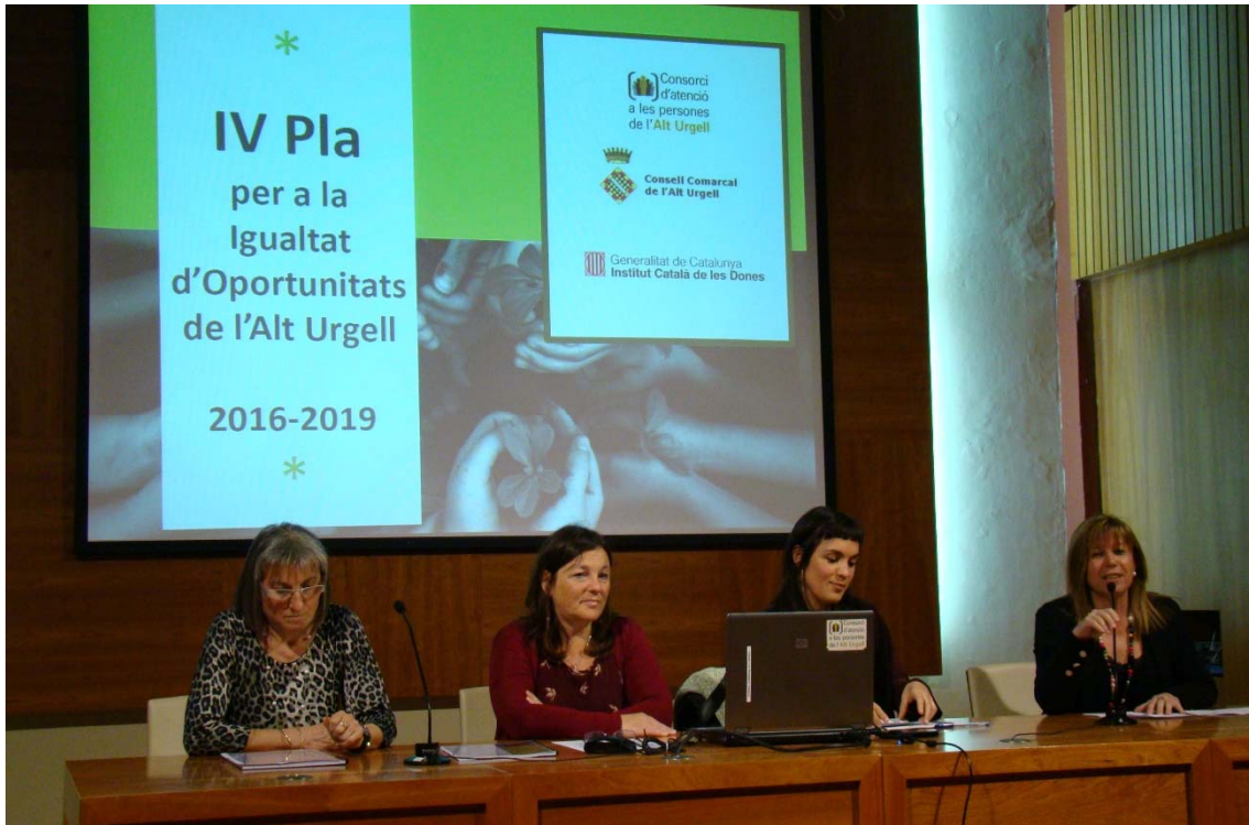
Presentació del Pla d'Igualtat de la comarca