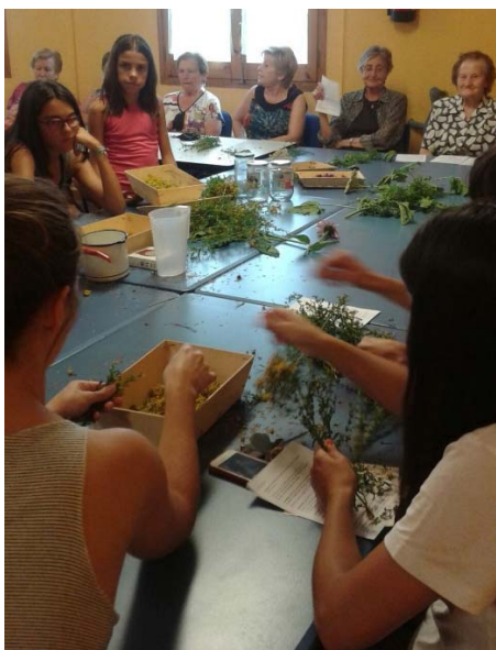
TALLER DE PLANTES BENEFICIOSES PER A LA PELL. 09.07.16