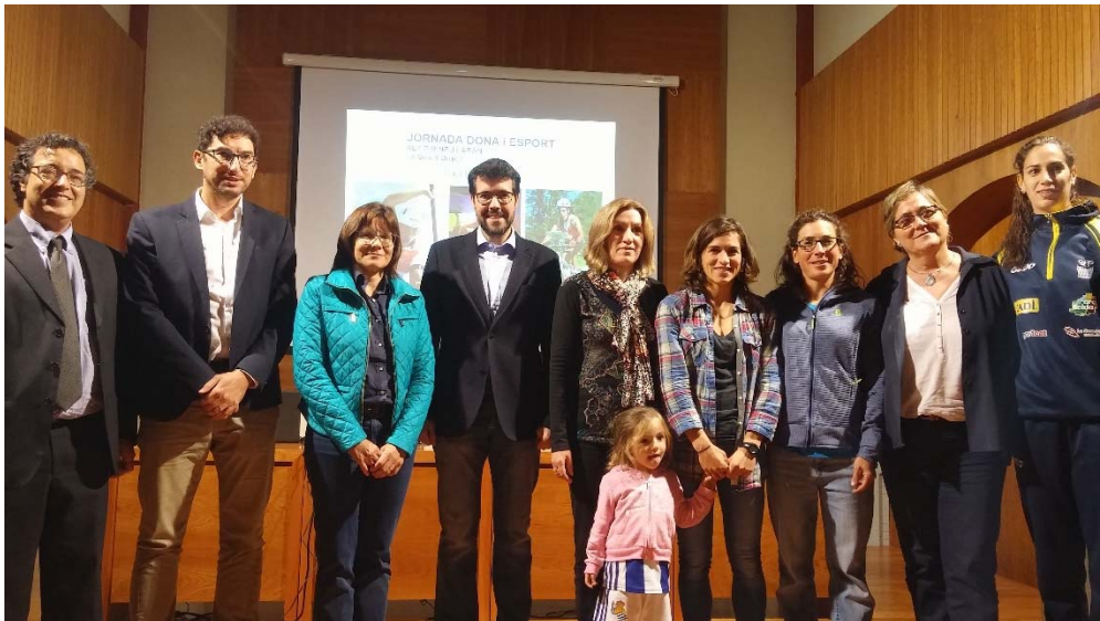
Jornada Dona i Esport: L'excel·lència de l'esport femení en els Jocs Olímpics