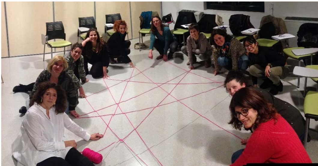
Formació Emprendedores liderant