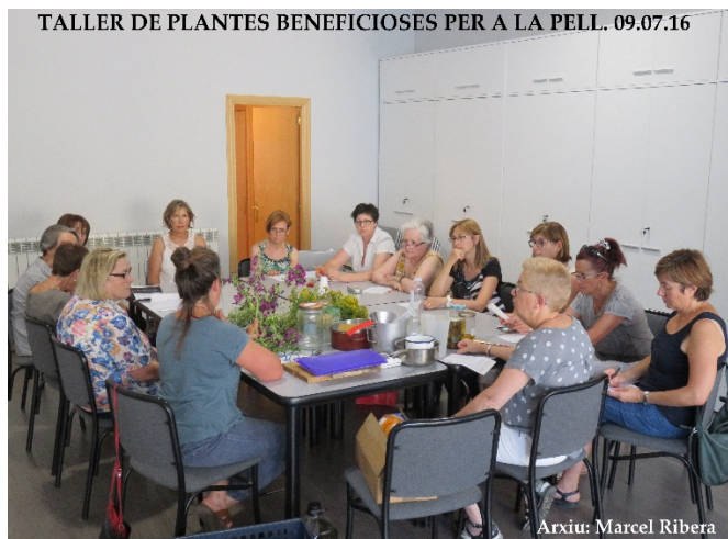
Taller de plantes beneficionses per a la pell a Adrall i a Oliana