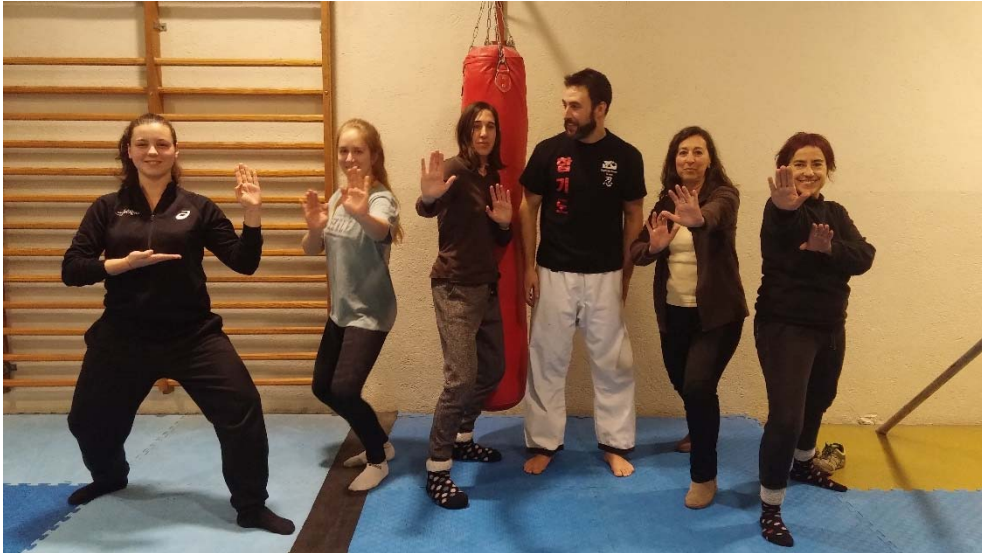
Taller de defensa personal