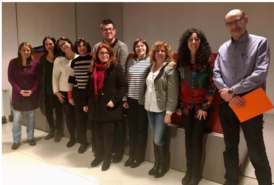
Jornada Igualtat i mitjans de comunicació