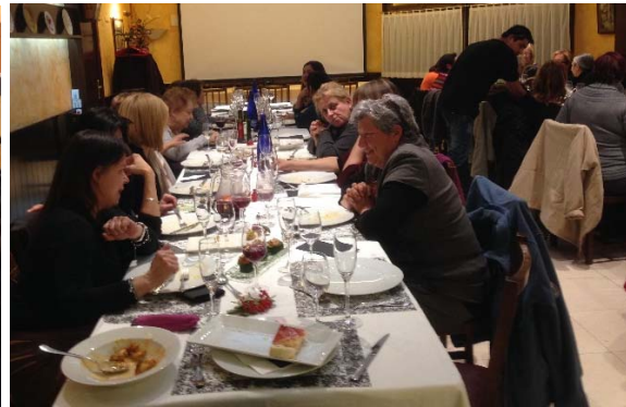
8 de març, Dia Internacional de les Dones. Actes a Coll de Nargó