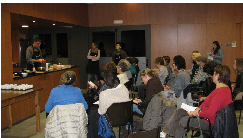
Taller d'aperitius a Peramola