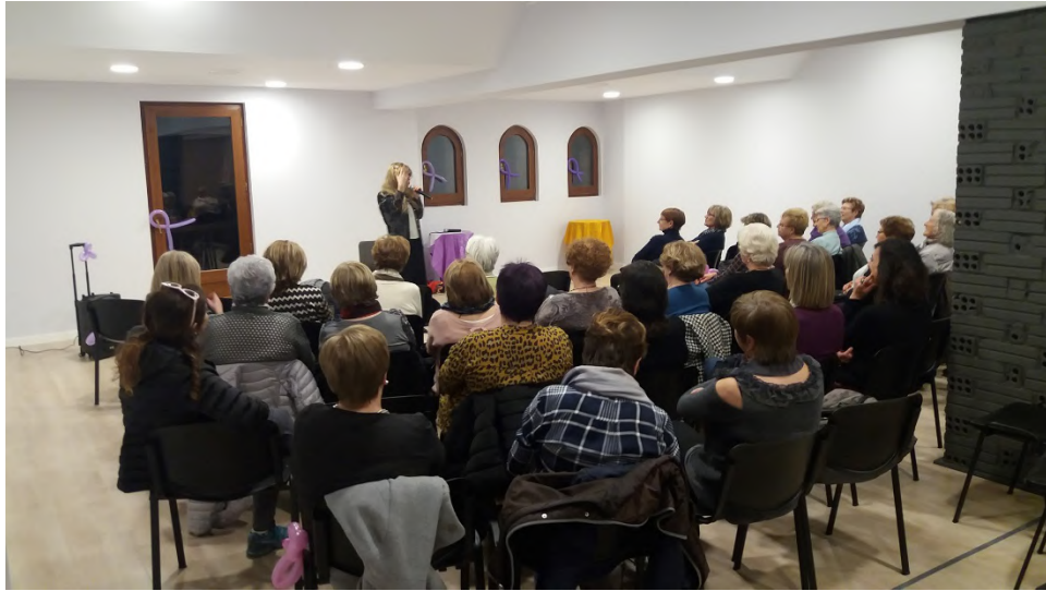
Actes 8M a Organyà