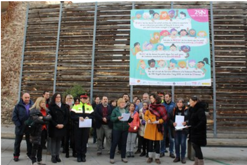
25 N. Dia internacional per a l'eradicació de la violència masclista