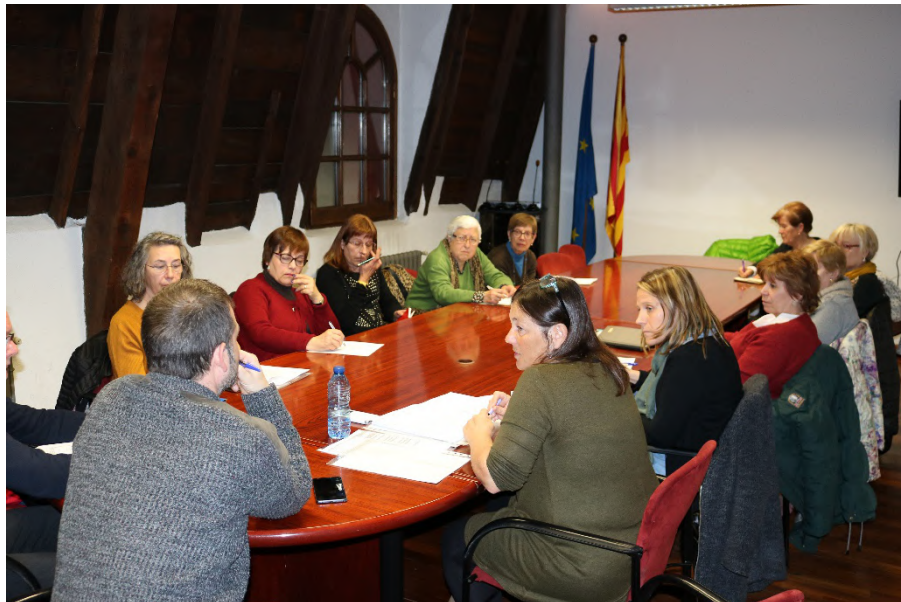
Exposició Vull ser qui soc