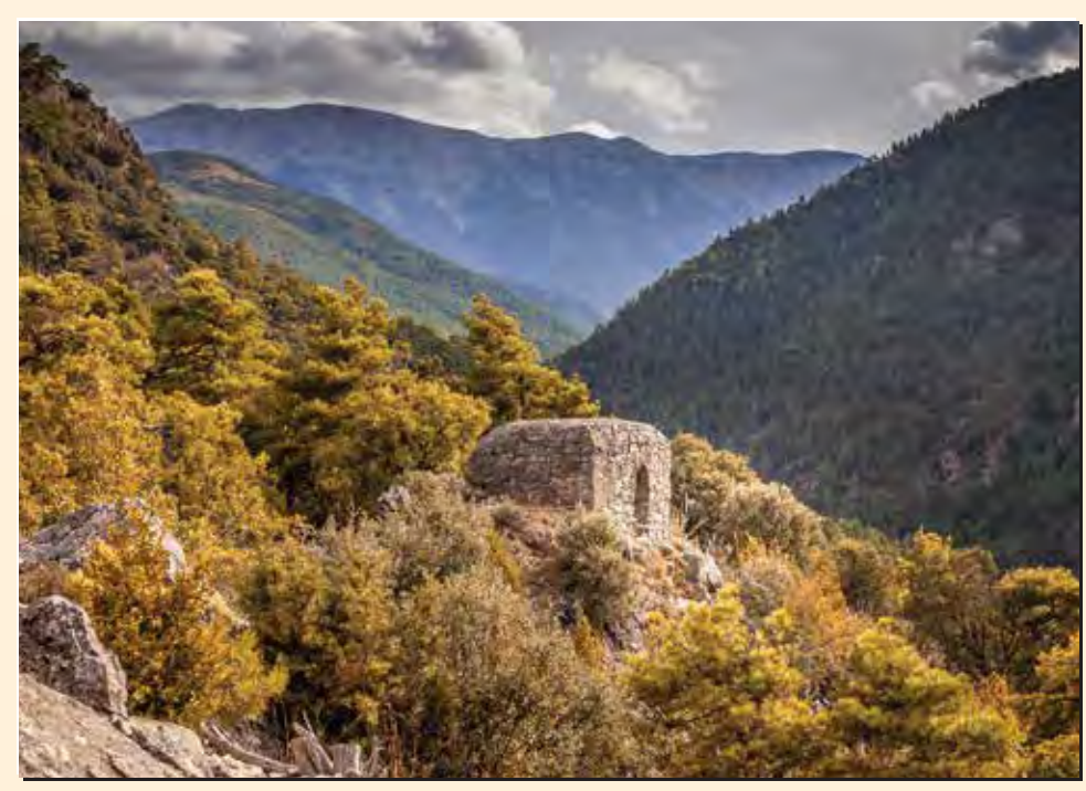
3 Búnquers del bosc de Rossa Búnker / Bunker / Bunker