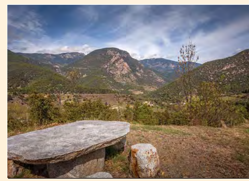
2 Mirador d'Arsèguel Mirador / Lookout / Point de vue