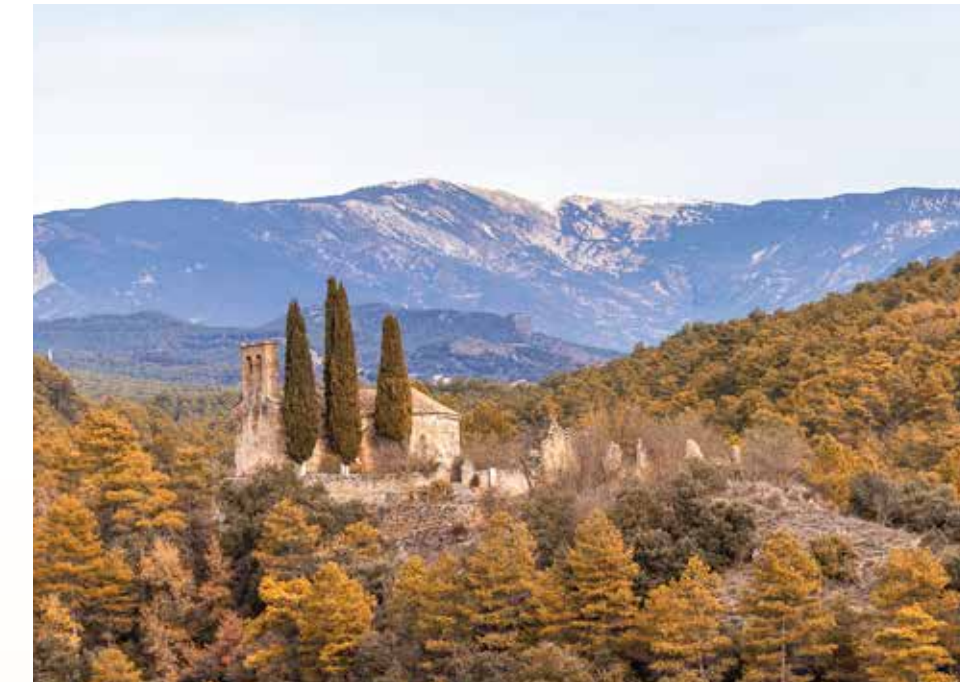
1 Església de Sant Serni de la Salsa Iglesia / Church / Église