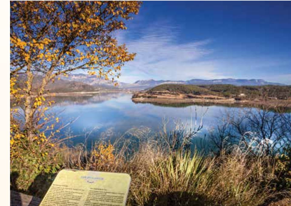
2 Mirador de la Clua Mirador / Lookout / Point de vue