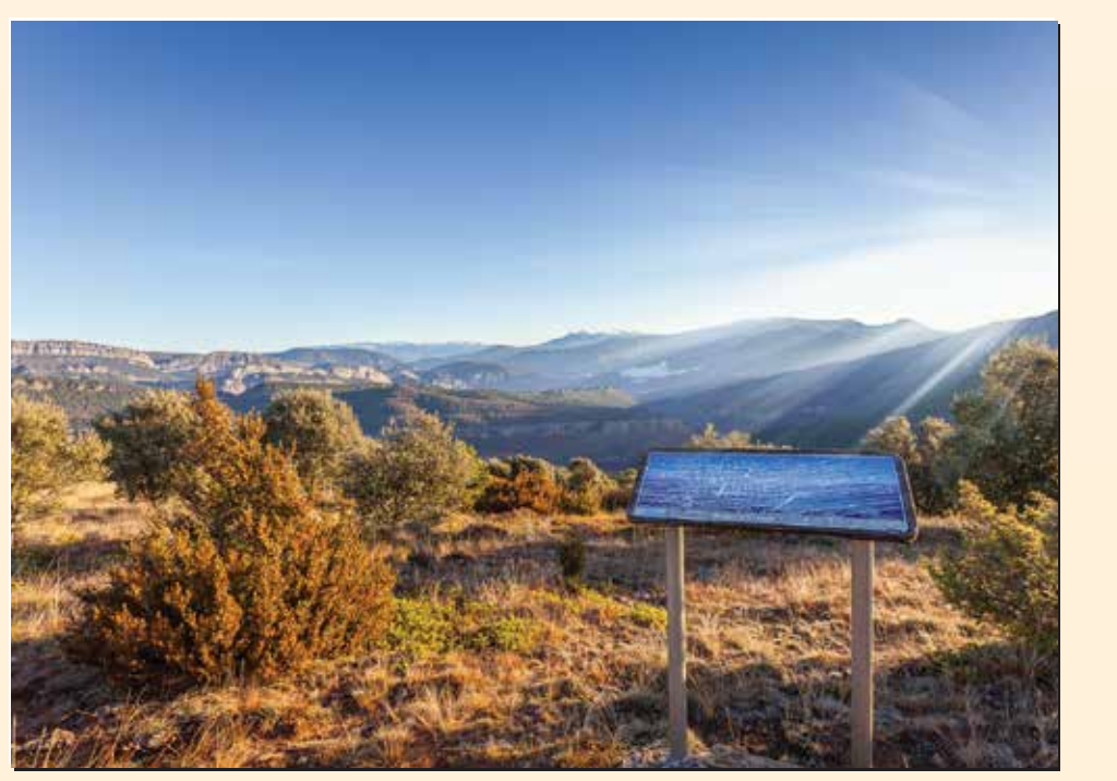
4 Mirador de Gavarra Mirador / Lookout / Point de vue