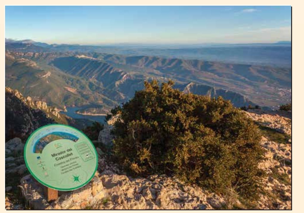
3 Mirador del Coscollet Mirador / Lookout / Point de vue