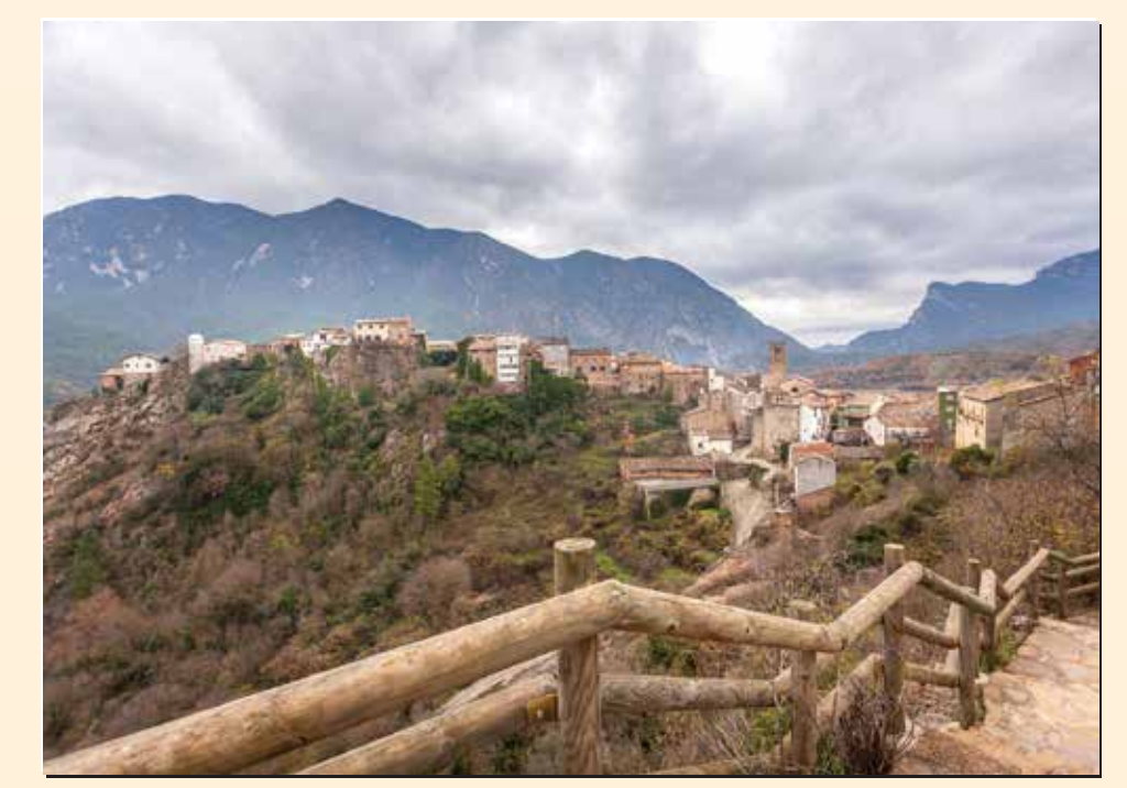
1 Mirador de Coll de Nargó Mirador / Lookout / Point de vue