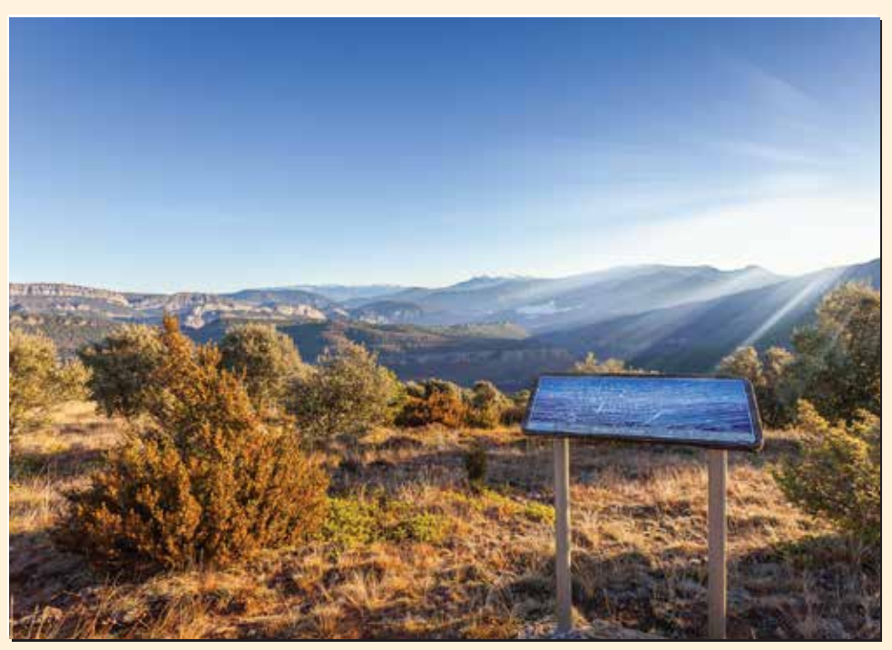
4 Mirador de Gavarra Mirador / Lookout / Point de vue