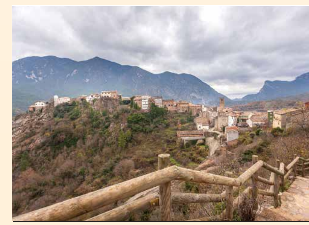
1 Mirador de Coll de Nargó Mirador / Lookout / Point de vue