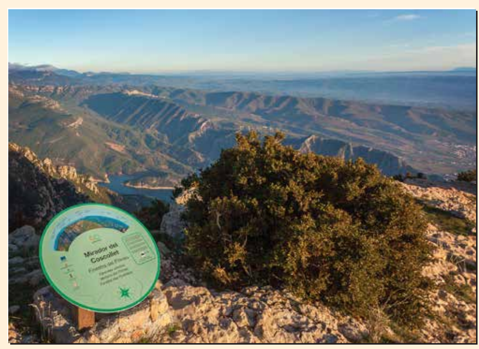
3 Mirador del Coscollet Mirador / Lookout / Point de vue