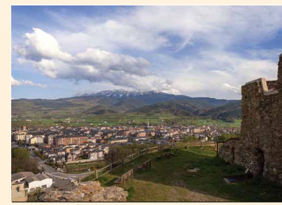
1 Mirador de la torre de Solsona Mirador / Lookout / Point de vue