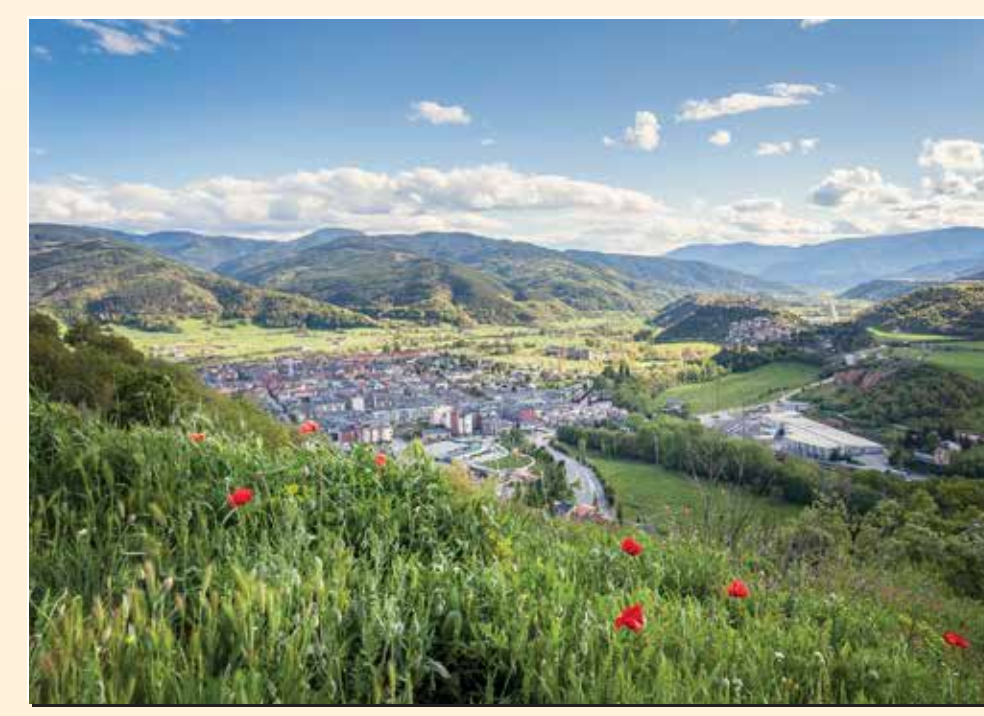
2 Mirador del pla de les Forques Mirador / Lookout / Point de vue