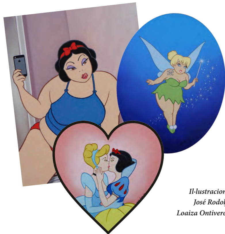
Il·lustracions: José Rodolfo Loaiza Ontiveros.