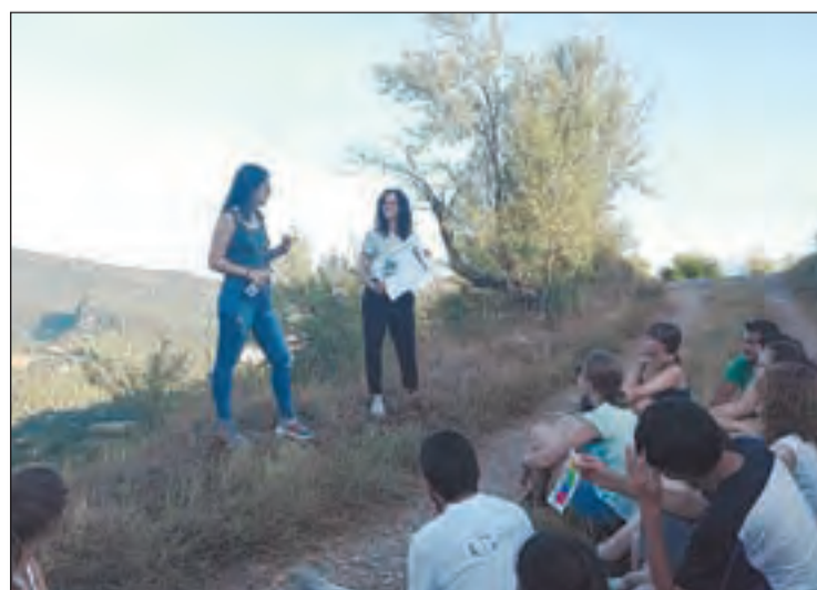
Han participat un total de 15 joves de 10 països

Aquest any les tasques del Camp de Treball han estat vinculades a la restauració de camins vers al patrimoni cultural ja que justament és l'Any Europeu del Patrimoni Cultural. En aquest sentit, els joves han dut a terme actuacions de manteniment en