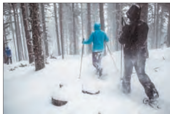
Aquesta temporada s'han venut 938 forfets