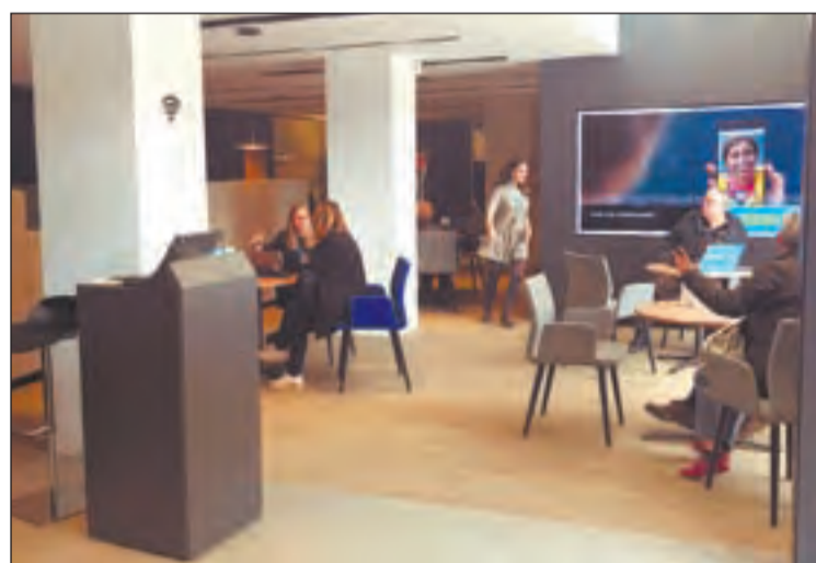
La nova oficina està al Passeig de l'Estació

CaixaBank va obrir ahir al centre de Balaguer una oficina del seu innovador model Store, amb l'objectiu de reforçar el seu posicionament a la ciutat. Les oficines Store representen un nou model d'atenció personal que es va iniciar el 2013. CaixaBank té avui 183 oficines d'aquest model a Espanya, fet que consolida l'entitat com un referent en innovació i en qualitat de servei. La nova oficina Store Balaguer, situada al Passeig de l'Estació, 25, va obrir portes ahir. Store Balaguer disposa d'una superfície aproximada de 405 m2. Compta amb 16 empleats i gestiona més de 12.500