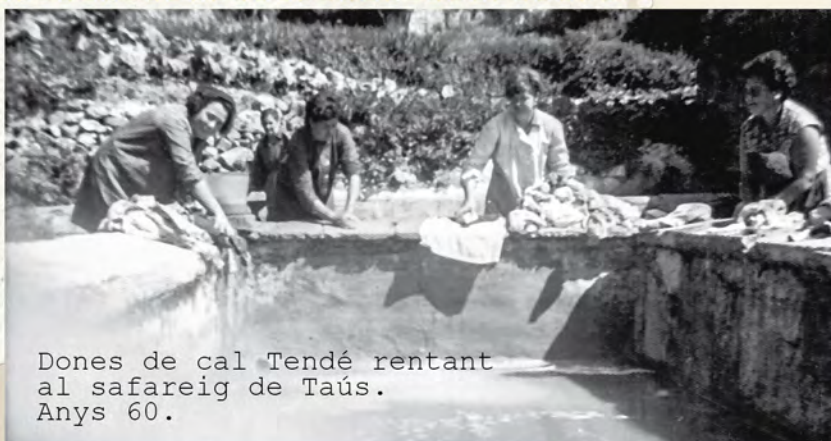
Dones de cal Tendé rentant al safareig de Taús. Anys 60.